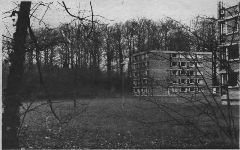
Nu staan er nog bomen. Straks worden er misschien bomen klaargemaakt. In exclusiviteit: het bouwterrein van Alma's centrale keuken.

Nvdr: Wij hebben nooit geschreven dat het monitoraat overbodig is: er bestaat nu eenmaal zo iets als een kontekst, die niet mag worden weggedacht.