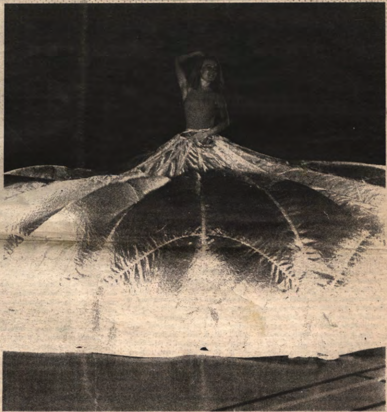
LISST - Vorige week (hik) was het (burps) weer zo ver (bweurk). Het Lisst-toernooi - Sport, weet u wel - had plaats in Leuven. Deze dame opende met vele anderen het feest, waar ook onze rektor heenging. Bezwarende details op pagina 7.