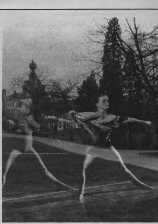
Vreemd. Ook u zal vreemd opkijken wanneer u - net zoals deze bevallige schone - op dinsdag, woensdag en donderdag naar het Arenbergkasteel trekt. Leuven gaat Vreemd speelt zich namelijk af in het Arenberginstituut, in de Naamsestraat 96. Een naamsverandering dringt zich hier duidelijk op: in Arenbergsluis en Arenbergkollege. Voor alle eenvoud.

Voor het volledige programma: zie onze onvolprezen Agenda