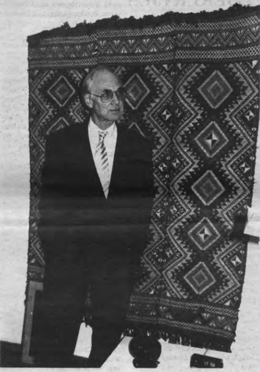
Het is vijf voor twaalf...