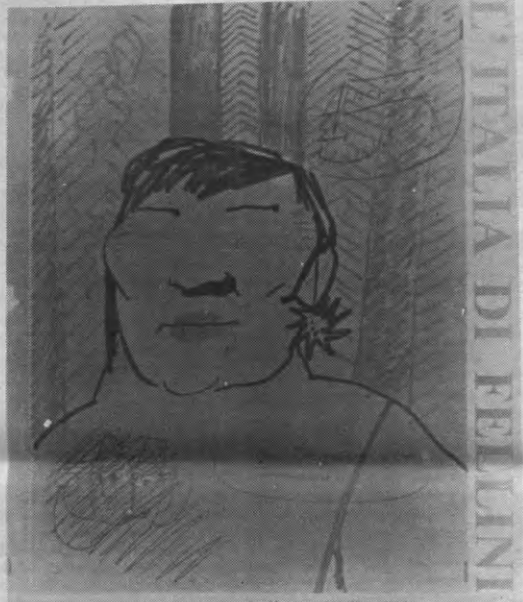
organisatie: Stuc - Centrum Italiaanse Studies KU Leuven

Veto: Het festival besteed ook aandacht aan Fellini voor 1950. Dat is die periode uit zijn artistieke loopbaan waar hij nog niet als zelfstandig regisseur werkzaam was.