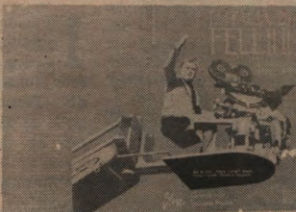
Italia di Fellini