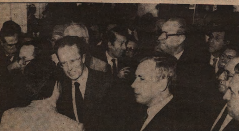
Flanders' Technology: een foto met Gaston Geens.