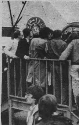
Flanders' Technology: een foto zonder Gaston Geens.