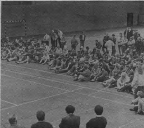
LISST — Als u dit leest, is de tweede editie van het Leuvense Internationale Studentensport Tornooi al ongeveer halfweg. Op de foto ziet u dat de opkomst aan publiek vorig jaar zeker niet te wensen overliet, wat van de spelers niet gezegd kan worden, als we op de foto afgaan. Hopelijk dit jaar beter...?