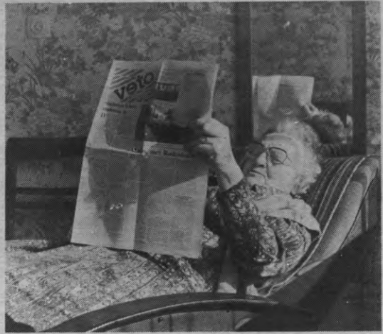
Zelfs Oma leest Veto.