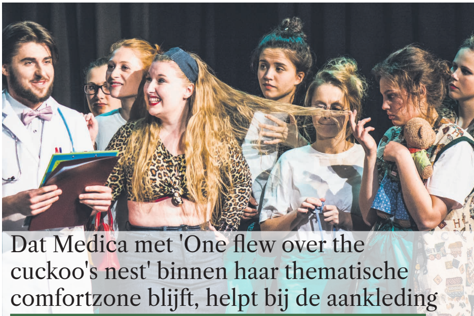
Dat Medica met 'One flew over the cuckoo's nest' binnen haar thematische comfortzone blijft, helpt bij de aankleding

Een veel te simpele oplossing voor een complex probleem – die ironie moet je maar waarderen.