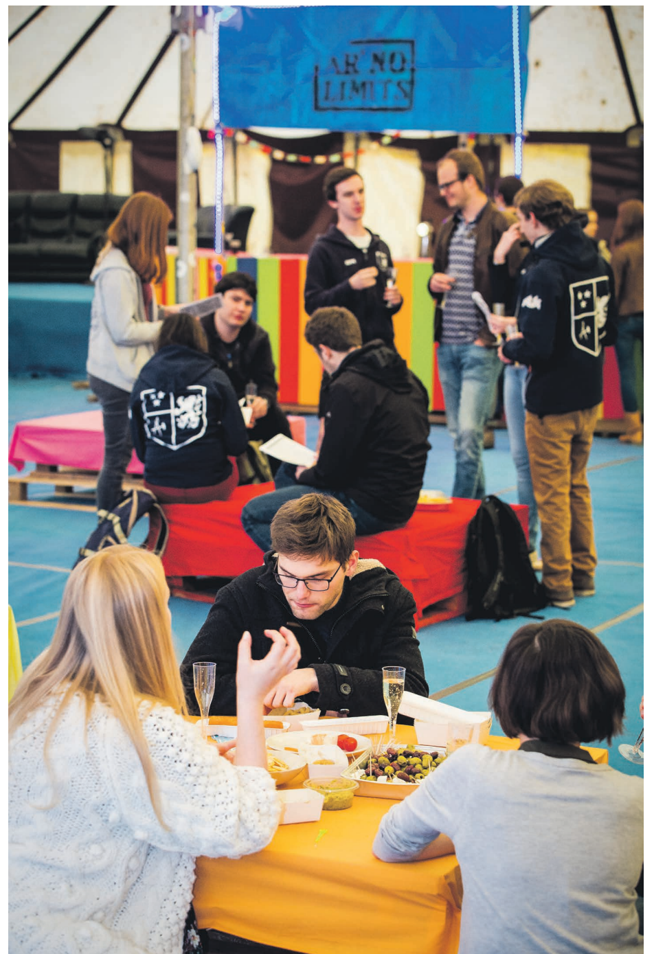
Kiesweek VTK 2017