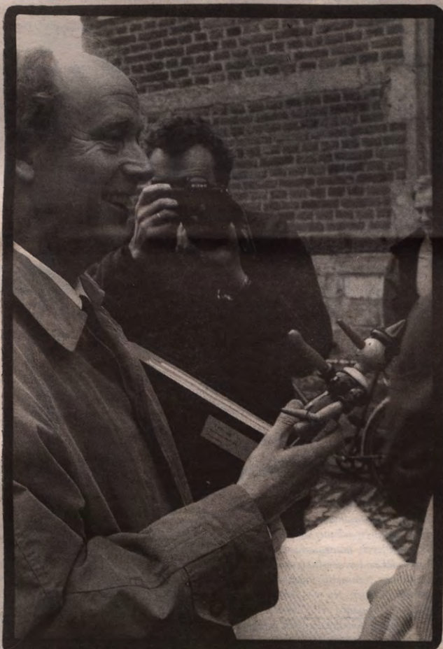
Dat Tirolerhoedje, die forse neus, die gestrekte rechterarm. Nee, we hebben het hier niet over Jörg Haider, maar over de Pinocchio's die vorige maandag door de studentenbeweging werden uitgereikt aan de dekanen van de vier fakulteiten waar men een verhoogd inschrijvingsgeld vraagt voor bepaalde voortgezette academische opleidingen. Zie pagina 6

Maar misschien wordt de uitvoering van het dekreet uitgesteld. Minister van Volksgezondheid Magda Aelvoet (Agalev) heeft de Nationale Raad voor Kinesiterapie om advies gevraagd. De minister wil het kb op de uitstroombepaling ofte kontingentering nu gaan uitvoeren. Dat houdt in dat slechts een in aantal beperkt segment van de gediplomeerden een beroeps erkenning