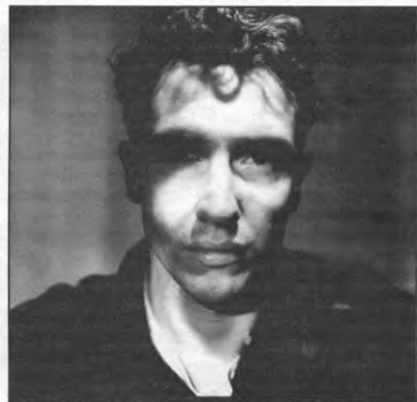
Platonov: "Ik drink op alles en ik drink alles op."

Deze Nederlandse musical, met muziek van Robert Long en teksten van Dimitri