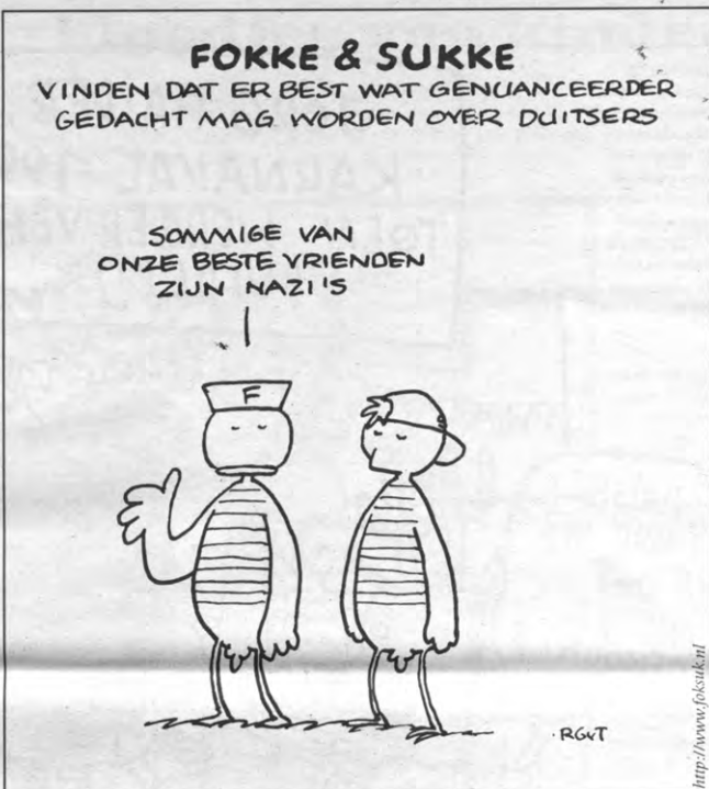
Fokke en Sukke hebben het allemaal al eens gezien

Stifter: «Als ik naar mijn eigen omgeving kijk, dan merk ik dat mensen die mee de straat opgaan interesse hebben om zich aan te sluiten bij een studentenorganisatie of bij een vakbond. Dat verleidt mij er ook toe om te denken dat de massabetoging van zaterdag geen eind- of hoogtepunt van de voorbije acties is, maar juist nog maar een begin. De demonstraties worden momenteel grotendeels gedragen door mensen die geen enkele politieke binding hebben en dat is op dit ogenblik een voordeel. De vakbonden zijn immers reeds sinds geruime tijd een deel van het systeem. Dit is een historische kans voor de vakbonden om na te denken over een herpositionering en over het inslaan van een nieuwe richting.»