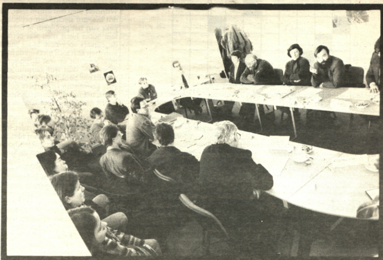
De bezetters luisteren braafjes mee

In die zin was de actie ook geslaagd: de werkgroep besloot een indekstatie van de beurzen te adviseren. In hoeverre dat juist te wijten is aan de bezetting — die er geen was: de stu-