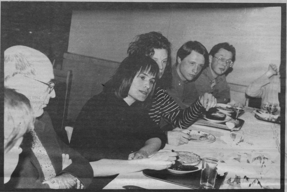
Kristien Hemmerechts in de Alma: 'zo'n lieve foto' vonden wij zelf

In het kader van het veertigjarige bestaan van Alma worden een aantal ontmoetingen georganiseerd met bekende figuren. Eerste in het rijtje was Kristien Hemmerechts. Elf mensen konden haar hun lang gekoesterde vraag stellen tijdens een entente in Alma één. Hemmerechts vond de spinazie te zout en at slechts een kwart van haar groententaart op. Echtgenoot Herman De Koninck zorgde af en toe voor backing vocals en at intussen zijn kom lasagne braafjes leeg. Wij namen verslag van het gesprek.