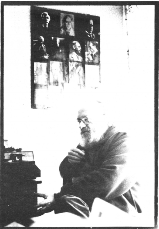
Filosof Leo Apostel opende dit jaar 'Kritische Universiteit' aan de Kulak