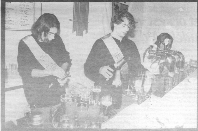
De inspiratiebron voor vele kafeetorieën

Hoe het ook zij, fakbars zijn een essentieel element in het Leuvense uitgaansleven en moeten zeker blijven. Al was het maar omdat de drank er zo goedkoop is en de nachten zo plezant. (md)