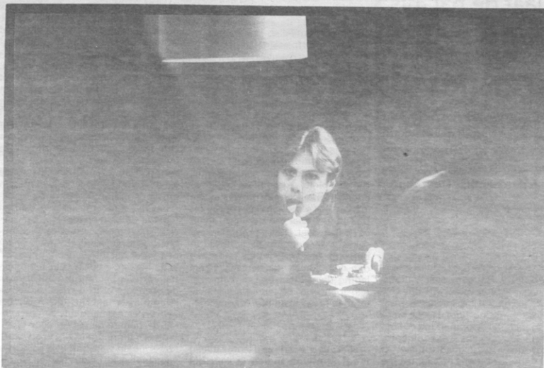
Van gehaktballen tot groentetaart