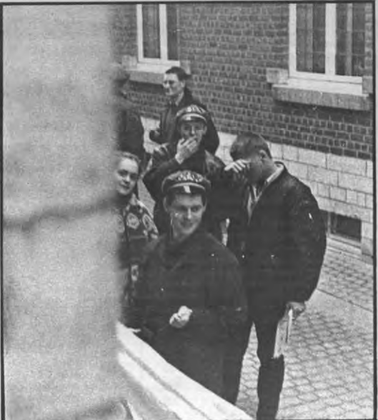
Ze zijn zo lief, meneer