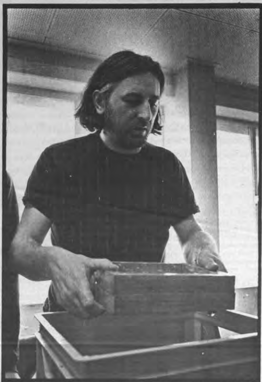
Op de zevende dag schiepte god papier

Decoster: «Het doet er niet toe of ze er helemaal in slagen om de werken te assimileren. Ik vind het belangrijker dat ze er onbevooroordeeld naar kijken en dat het reactie bij hen loswekt. De discussie die daaruit voortvloeit helpt je op weg. Kunst is geen oplossing. Je moet geen pasklare ant-