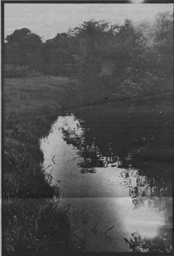
O ruisen van het ranke riet

"Op dit ogenblik is Zen in Japan, ondanks de duizenden Zen-tempels, op sterven na dood.