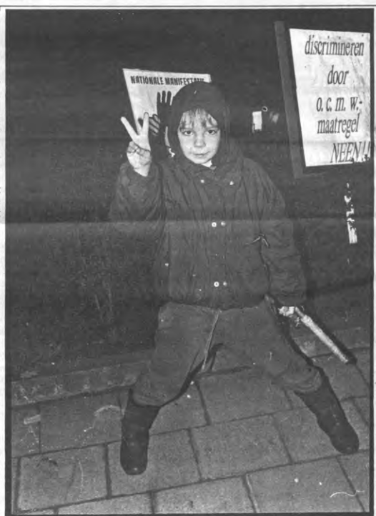
Zo jong en nu al geëngageerd