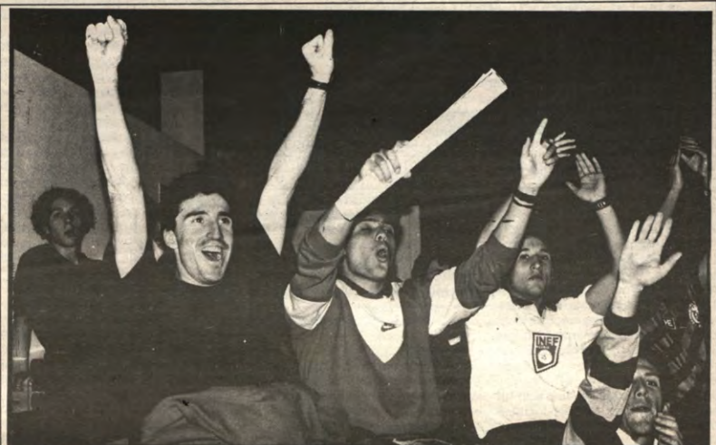
Sport — Deze week zakken vierhonderd buitenlandse studenten af naar Leuven voor de tiende editie van het Lissit (Leuven International Students Sports Tournament). Sporters uit tien landen (Polen, Roemenië, Tjechië, Oekraïne, Nederland, Duitsland, Frankrijk, Spanje, Portugal en Groot-Brittannië) en twintig universiteiten meten zich met de beste Leuvense teams. Voor Leuven treden de volgende ploegen aan: voetbal heren (Ekonomika, VTK), basket heren (Chemika, Vlaamse Monniken), basket dames (Apollonia, LBK), volley heren (Apollonia, VTK) volley dames (Apollonia, Terbank). Programma op pagina 5.