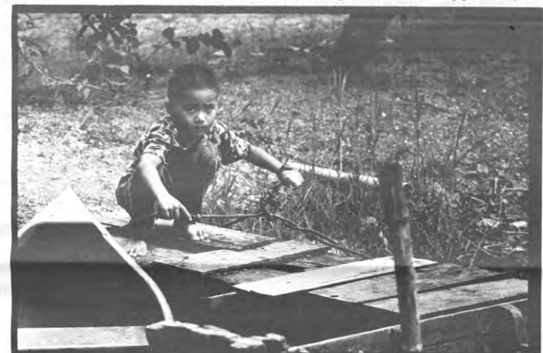
Zijn die verschillen echt zo groot?