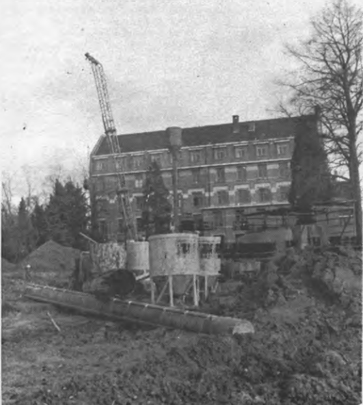
Terbank II: op donderdag kwamen mensen het terrein bekijken. De maandag daarop begonnen de werken.