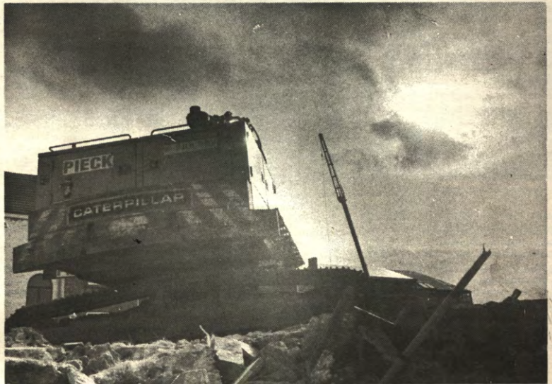
MILIEUHINDER - Bulldozers en kranen maken lawaai. Niks ergs, zal u zeggen. Tenzij u op kot zit in de buurt van de bouwwerven van Terbank 2 of van de nieuwe fakulteit Economie aan de Naamsstraat. Veto legde zijn oor te luister bij de omwonenden aldaar. Een relaas op pagina 2.