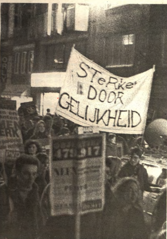
De optocht van het Anti-Racistisch Forum (ARF), vorige week woensdag, bracht een tweeduizendtal manifestanten op de been. Toch lijkt bij de Leuvense studenten een soort betogingsmoedigheid te zijn ingetreden. Een verslag op pagina 8.