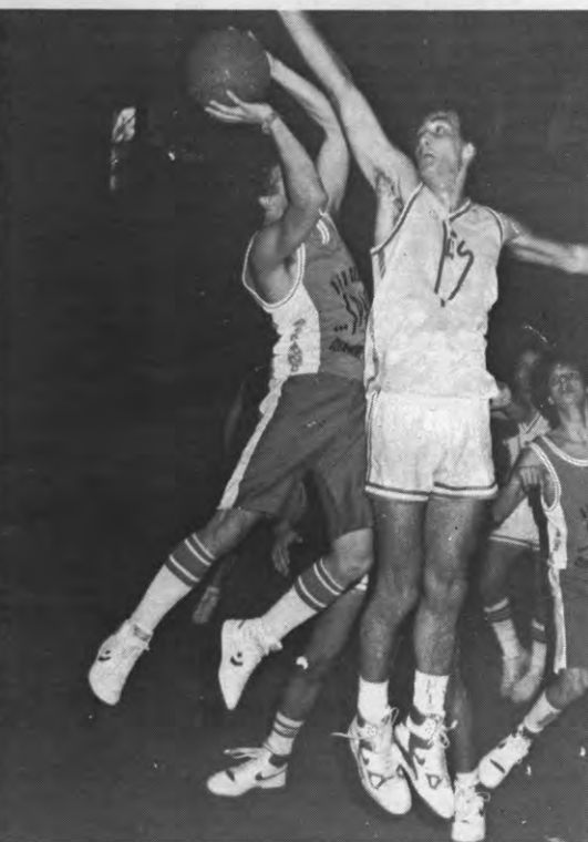
De basketballers uit West-Londen maken het smerig tijdens het Lisst. Vakkundig gestopt.

Première van 'Torquato Tasso' op dinsdag 3 maart om 20.30 u in het Stuc, daarna tot en met zaterdag 7 maart dagelijks om 20.30 u een opvoering.