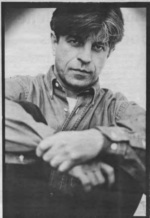
«Op de scène zal alles duidelijk worden. Het stuk kan niet slecht zijn als de acteurs zich realiseren wat ze zeggen.»

Peyskens: «Alles wat voelbaar, tastbaar, ruikbaar is, kan door iedereen die over de nodige zintuigen beschikt, geobserveerd worden. Ik heb indertijd 'KIT' gemaakt, bewust voor Jan en klein Pierke. Tot in Italië was dat een enorm succes, zonder dat het ging om 'Schipper naast Mathilde'- of VTM-toestanden. Het hangt er eigenlijk van af tot wie je je richt. Sommigen zullen 'Torquato Tasso' interessant vinden, anderen zullen het helemaal niet appreciëren. Mijn moeder bijvoorbeeld, is met andere dingen bezig dan ik. Ik denk niet dat dit stuk haar zou interesseren. Toen ik 'The KIT' maakte, zei ze me: "Nu maakt ge tenminste