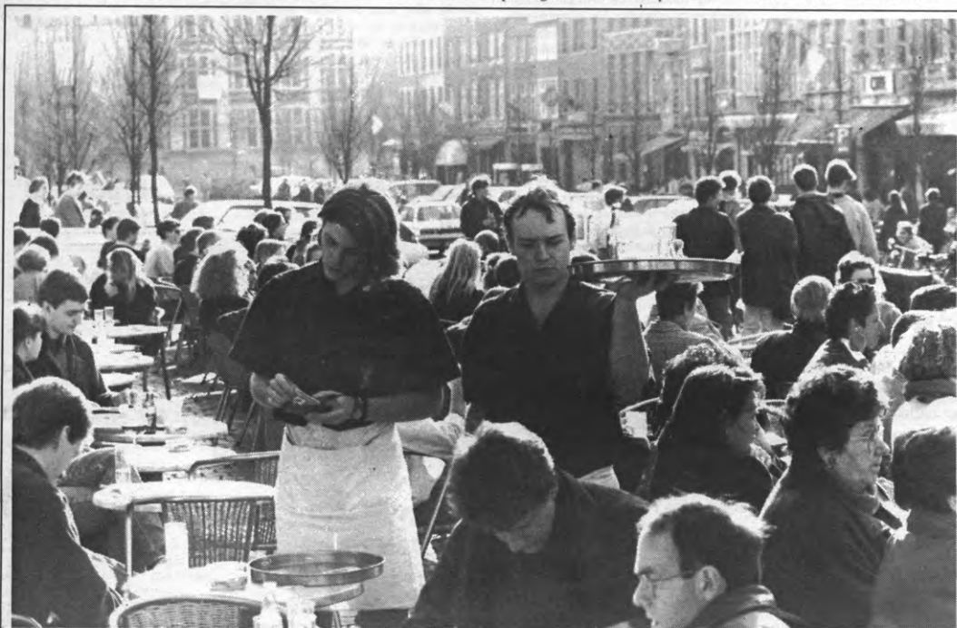
Heerlijk lenteweertje dezer dagen. Afgelopen weekend: de eerste terrasjes van dit jaar op de Oude Markt. Nu kunnen we tenminste met een rustig gemoed beginnen blokken.