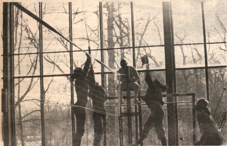
Net als vorig jaar rond deze tijd, breekt Leuven deze week haar grenzen open voor alle EG-studenten-sporters.

STUDENTENWEEKBLAD VAN DE LEUVENSE OVERKOEPELENDE KRINGORGANISATIE - JAARGANG 17, 1990-1991, NUMMER 21, MAANDAG 25 FEBRUARI 1991