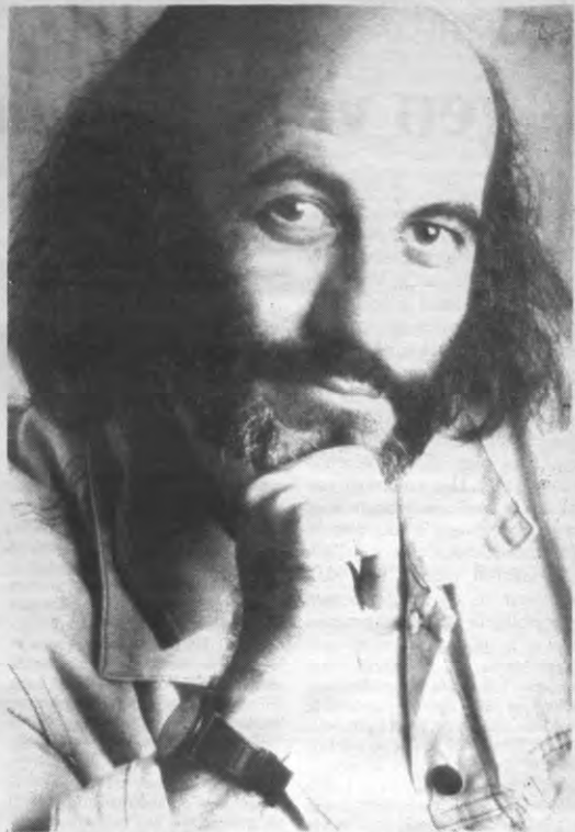
«Na vijftig jaar in dit beroep beleef ik steeds meer plezier aan het tekenen van paarden, omdat ik inmiddels technisch meer onderlegd ben.»

Derib: «Dát heb ik nooit gezegd, maar wel dat er aan de reeks een einde komt. Buddy kan niet in een album sterven, omdat hij zijn levensverhaal vertelt. Meer wil ik daar niet over kwijt ( lacht ), om de sfeer van de volgende verhalen niet te bederven.»