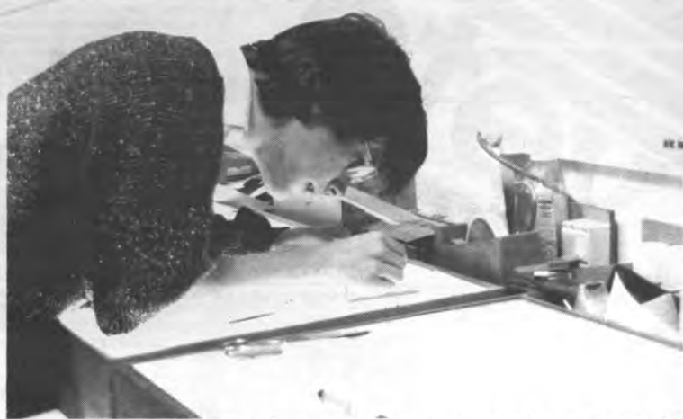
De karrière van deze knappe, vriendelijke jongen verliep als een bliksemstraal. Na een korte zwerftocht door de geleerden van de Leuvense studentenbeweging, werd hij dit jaar plots sterreporter van Veto. Onderwerpen in zijn vierde Unix-kursus, heeft hij het lay-outen onder de knie, en naar het schijnt plant hij voor volgende maand zijn eerste foto-reeks. Wie hem in het voetspoor wil treden, kan zich nu reeds aanmelden bij Veto, 's Meiersstraat 5. Werk verzeerd - zonder sollicitatie-eksamen - voor kritisch ingestelde, op vrijwillige basis naar kwaliteit strevende schrijvers, tekenaars, zettters, lay-outers en fotografen.

en heeft niet het recht om zich te beroepen op culturele eigenheid. Bescherming van de vrouw is een mooi principe in de Koran, maar waar ligt de grens met paternalisme en dominantie. Denk maar aan het recente protest van enkele Saoedische vrouwen tegen het formele rijverbod voor vrouwen in dat land.