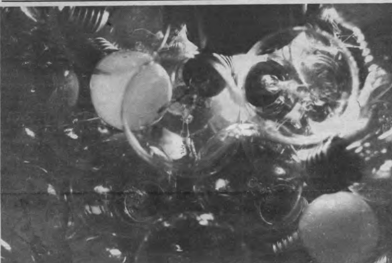
Wellicht herkent u dit niet. Wij ook niet.