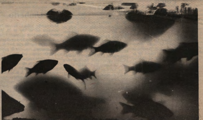
Deze vissen geven wel geen licht, maar dat zal hen een zorg zijn.

Hoe moet je als toeschouwer (en het publiek was massaal aanwezig) zo'n project bekijken? Wie vóór het project een programmaboekje had gekocht en gelezen, werd tot een bepaalde kijkhouding gedwongen. Gelukkig kostte het boekje honderd frank, en werden ze niet nadrukkelijk aangeboden, want de lektuur is een koude douche. Luuk Rademakers, die het project toelicht en de kunstenaars voorstelt, lijkt heel erg zijn best te hebben gedaan om 'Leuven Wellicht' van het label postmodern te voorzien. Dat is natuurlijk niet echt een bezwaar, en er waren uiteindelijk ook niet veel mensen die zich die vraag stelden. Weinig mensen hadden behoefte aan moeilijkdoenerij. 'Leuven Wellicht' moet je zien als een avontuurlijke tocht door Leuven, een uitstapje, een belevenis die op het moment zelf belang heeft, en die je daarna gerust kunt vergeten. In de herinnering van de mensen zal vooral overblijven dat dit AV-project leuk was, met veel sfeer , soms een beetje kunstmatig, maar nooit echt ergerlijk.