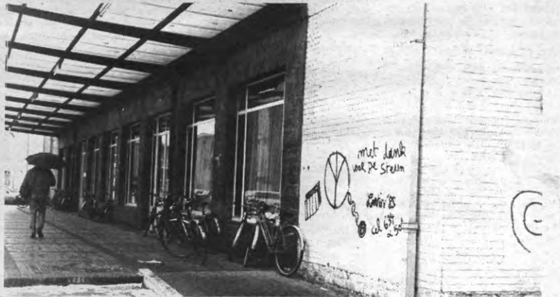
Op zo'n muur kunnen graffiti hun charme hebben, maar de kwaal tastte ook muren aan die een charme hebben