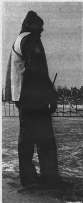
In Holland maakt de Bende van Nijvel geen kans. Een ijsflik klaar om hen achterna te klunen.

Maar wie de beelden van het gehos langs het parkoers van de Elfstedentocht op TV gevolgd heeft, zal toch wel onwillkeurig gedacht hebben aan het Karnaval van Rio, zoals Antenne 2 het een paar weken geleden in beeld bracht. Met dit verschil natuurlijk dat het in Rio moeilijk was om een plakje tekstiel op de huid van de mulatjes te ontdekken, terwijl het in Friesland moeilijk was een stukje huid temidden de tekstiel te herkennen. Maar voor de rest was de gelijkenis frappant. Een vraag toch: hoe komt het toch dat deze strengereformeerde Friezen pas in ekstase raken als de Noorderwind rond hun oren fluit, hun botten bevroren en de woeste elementen in hun gezicht slaan? Moeten calvinisten eerst lekker afzien vooraleer zij durven genieten? En hebbet, wij dat dan toch voor op hun dat wij eerst kunnen genieten en daarna pas gaan afzien? Zou ik de maandelijkse biecht toch maar niet hernemen? Zondigen kan immers zo prettig zijn. (ED)