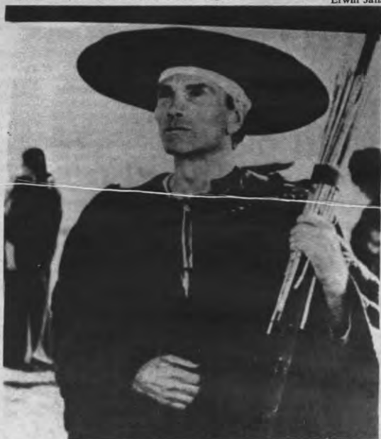
Pasolini: stem in de woestijn van een sensuele jeugd vol geweld.