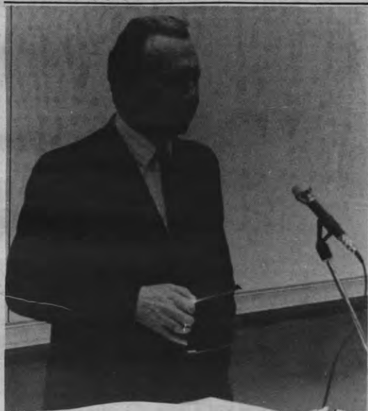
GANDOIS kwam, zag en saneerde. Studenten die eerst niet uitgenodigd waren door AIESEC mochten binnen wegens de lage respons van het bedrijfsleven, voor een vierde van de prijs.