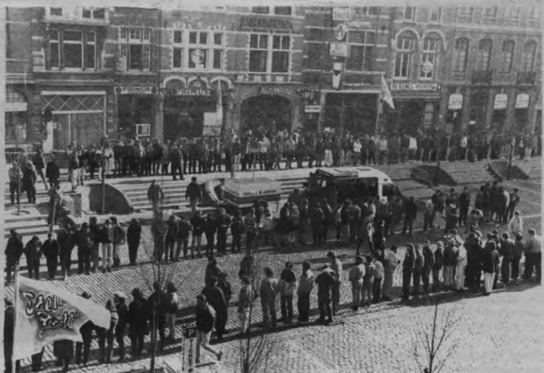
Sinds WC's in geheel Leuven stukspringen kennen de openbare toiletten op de Oude Markt een