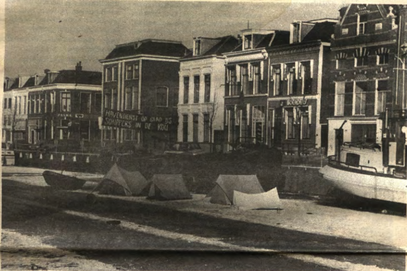
NIET IEDEREEN IS GELUKKIG. Omdat de Elfstedentocht (zie p. 10) moest en zou doorgang vinden, werden de binnenwateren in Friesland met opzet bevroren gehouden. Ijsbrekers mochten niet uitrukken om voor een vrije doorvaart te zorgen. 10 miljoen TV-kijkers en een miljoen toeschouwers zullen dit niet zo erg gevonden hebben. Maar de heren en dames binnesschippers waren er veel minder over te spreken. Om aan hun ongenoegen uiting te geven, richtten zij naar aloude Hollandse protestgewoonte een ijstentenkamp op.

Verantw. Uitg.: Filip Huyzentruyt 's Melerstraat 5, 3000 Leuven Tel. 016/22.44.38