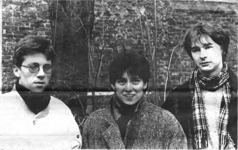
Samenwerken van mannen en vrouwen. De vrouwen zijn van overal, de mannen zijn van sociale pedagogiek.