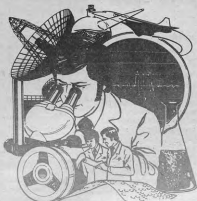
De voorpagina van het ter gelegenheid door VTK uitgegeven 'industrieboekje' met dagorde en info over de bedrijven; en de militaire toepassingen van al dat mooits?