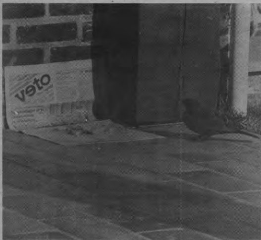
Voed uw tuingasten een beetje op. Op deze manier bijvoorbeeld pikt deze merel samen met zijn dagelijkse portie kruimels nog wat nieuws mee. En dat helpt ook bij mensen: elke donderdagmorgen bij koffie en ei.