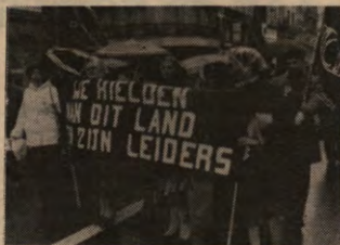
'Als er een leidende rol is van de Arbeiderspartij, dan mag die niet ingebakken zijn in de structuren, maar dan moet die telkens opnieuw verworven worden', aldus Solidarieteit. Krijgen de vakbonden in België ook dit inzicht? (foto: betoging van zaterdag 26 februari laatstleden.)