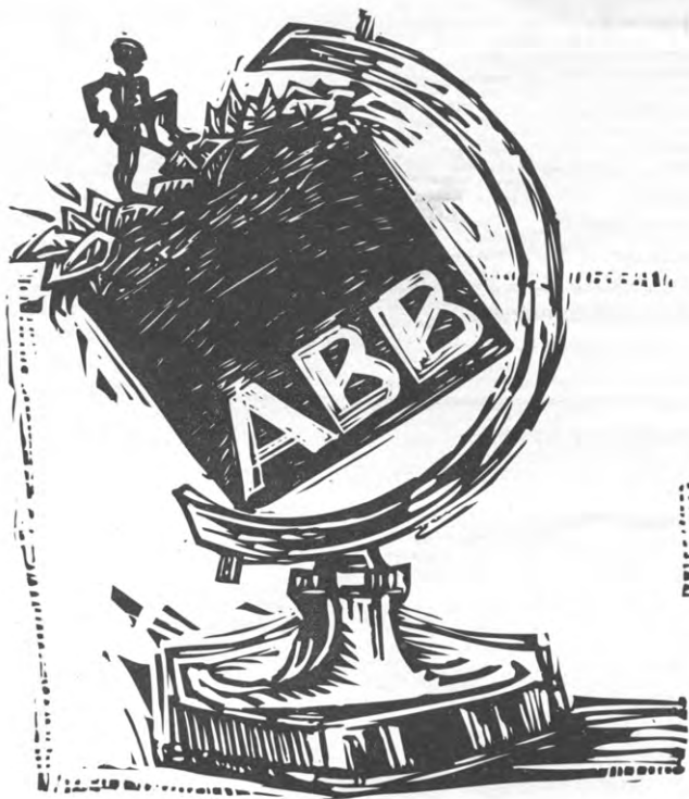
ABB MAAKT VERZEKERINGEN EEN STUK MENSELIJKER