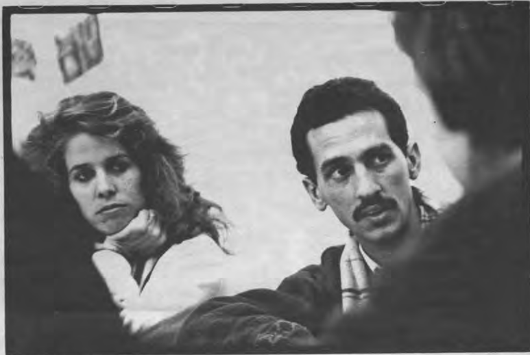
"Fidel zendt zijn zonen uit."

FEU: «Ja, er is een beperking van het aantal mensen dat kan beginnen aan de universiteit. Nu, met de ekono-