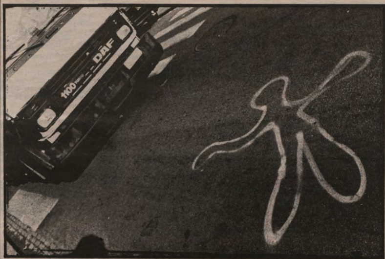
"Lijk overreden door stalen blik." (zie pagina 8)

Deze omgekeerde bewijslast is volgens het Ociv (de organisatie die de belangen van de asielzoekers behartigt) in strijd met de konventie van Genève waar het 'voordeel van de twijfel' ingeschreven stond. Ociv en