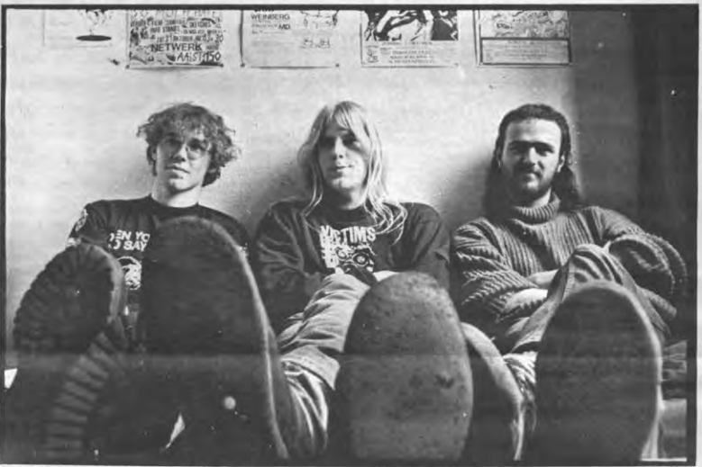
Zij willen geen voet aan wal krijgen