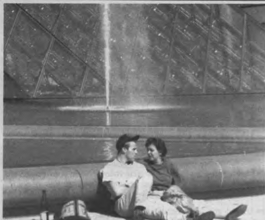
Groeien in lederheid.

De samenwerking van de Werkgroep Preventie met De Roze Drempeel houdt een impliciete erkenning in van De Roze Drempeel als representatieve vereniging