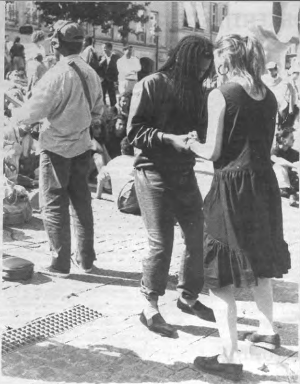
Een systeem kan vreemde elementen niet in onbeperkte mate laten binnendringen.

Tot op vandaag wordt de politiek van de Belgische Staat tegenover de problemen van de grote steden, meer bepaald het immigrantenprobleem, gekenmerkt door de weigering te erkennen dat het in wezen om een socio-economisch probleem gaat. Voor de wetgevers lijkt het probleem van de concentratie nog altijd in de eerste plaats van etnische oorsprong, dat bijgevoel opgelost moet worden door een dekoncentratie van de verschillende culturen. Het onderliggende principe van die houding is de zogenaamde 'tolerantiedrempel'. Volgens de drempel-theorie kan een gemeenschap slechts een bepaald aantal 'vreemde' elementen in zijn schoot opnemen. Als die drempel overschreden wordt, kan het systeem niet meer functioneren. Het begrip 'tolerantiedrempel' is in feite een metafoer, die zijn oorsprong vindt in de biologie: het gemeenschapsleven is als een organisme dat, als er teveel vreemde elementen