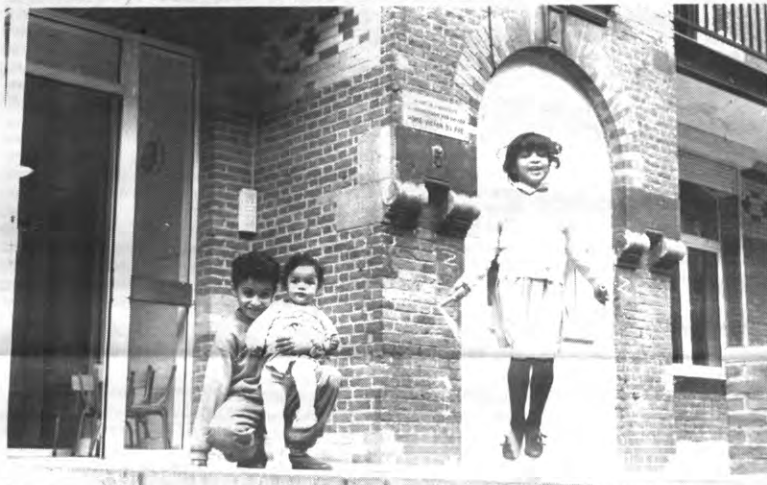
Ook in Veto zouden er eigenlijk ook wat meer gekleurde gezichten moeten komen. Zien we het niet allemaal wat té zwart-wit?

D'Hondt geeft niet alleen kritiek op het beleid, maar doet zelf originele voorstellen. Wanneer migranten economisch geïntegreerd worden in onze samenleving en niet - zoals dat nu gebeurt - economisch achtergesteld worden, kunnen ze een positieve weer-