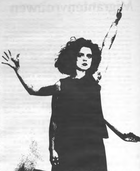
Moderne koorkunst: de traditionele opstelling werd verlaten voor een meer diskrete waarbij slechts één mond lijkt te bewegen.

In Aria , een werk voor sopraan-solo van John Cage, worden visuele en bewegingselementen geïntegreerd in de muziek. De typische houdingen en tierlantijntjes van de opera-zangeres