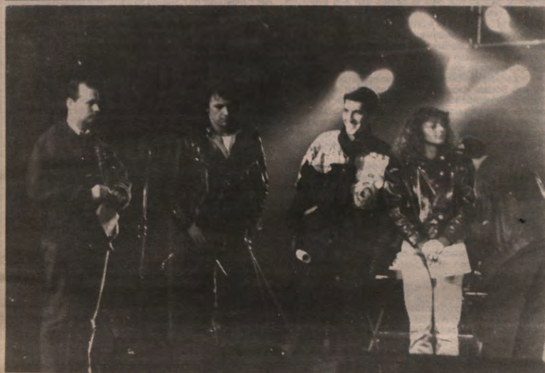
De 'echte' jury koos voor Ekonomika. De studentenjury dacht daar anders over.

STUDENTENWEEKBLAD VAN DE LEUVENSE OVERKOEPELENDE KRINGORGANISATIE - JAARGANG 17, 1990-1991, NUMMER 20, MAANDAG 18 FEBRUARI 1991