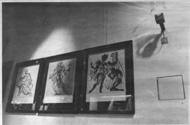
De Faculty Club doet zijn naam van extravagante non-konformistische kultuurtempel weer alle eer aan met de Dali-tentoonstelling. Wegblijven daar.