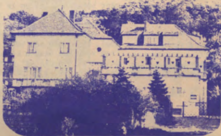
het verblijf in Avala

In de slotzitting van de meeting, werden ook twee moties goedgekeurd, voorgedragen door respectievelijk de Chileense delegatie (Chile Democratico) en de Palestijnse delegatie. Hierin werd respectievelijk de Chileense junta veroordeeld, de vrijheid geëist van politieke en studentenleiders in Chili en een oproep gedaan voor internationale isolatie van de junta. Anderzijds werd de bevrijdingsstrijd van het Palestijnse volk, o.l.v. de PLO ondersteund tegen het Israëliësch imperialisme.