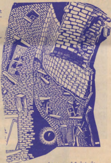
Het spreekt vanzelf dat de Huisvestingsdiensten en de Juridische Diensten van Studentenvoorzieningen graag bereid zijn eventueel verdere inlichtingen hieromtrent te verschaffen.

Ondertussen , vanaf 1 april 1976, kan de huurprijs natuurlijk ook niet meer verhoogd worden tot op het einde van het academiejaar.