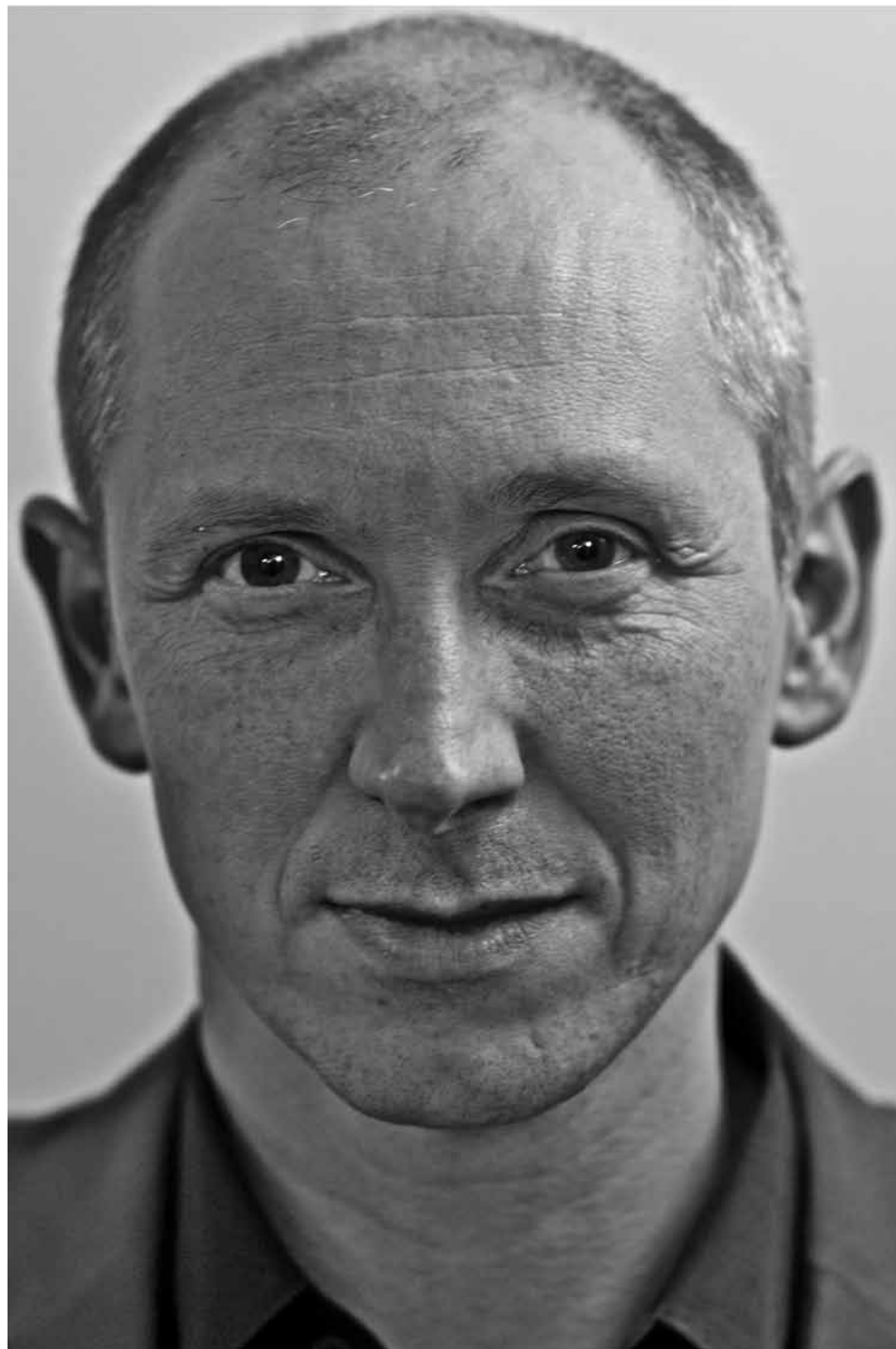
Helmut Lotti: “Platenwinkels zouden meer onderverdelingen moeten maken.”

Lotti: «Omdat ik net heel erg veel van afwisseling hou. Niet alleen in mijn repertoire, maar zelfs ook binnen een album. Ze zeggen nochtans dat een album één concept moet hebben van het eerste tot het laatste liedje. Ik vind dat saai. Ik heb graag dat het van de ene naar de andere kant wipt. Ik vind dat geestig.»