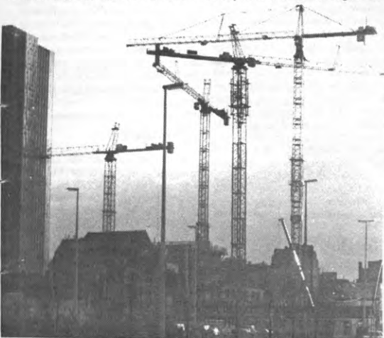
De aanleg van VdB's zomerhuis in Le Touquet.