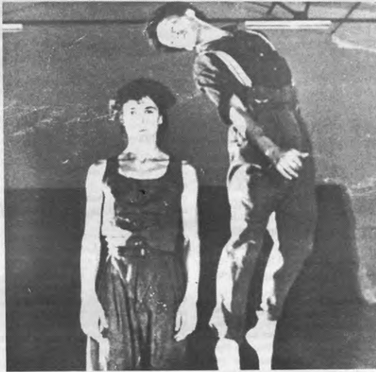
Wim Vandekeybus een omhooggevalen ster?