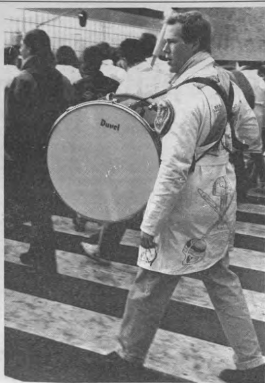
Nederlandse studenten met stille trom terug naar huis?

Bij deze brief kunnen zeker wat kanttekeningen gemaakt worden: hoe komt het dat de problemen met auditoria en praktika bij de Nederlanders wel ter