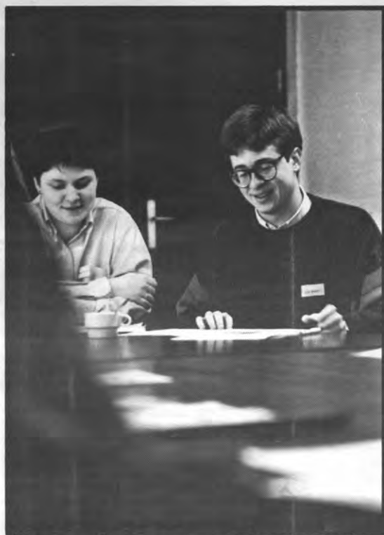
De pedagoog: een wulf in schaapsvacht.

De Leuvense Pedagogische Kring van haar kant voerde een enquête uit onder 172 laatstejaars van vier Vlaamse normaalscholen: zowel kleuterleiders, en kleuterleidsters-in-spie, als toekomstige onderwijzers en regenten werden ondervraagd. Niemand van de ondervraagden vindt de huidige opleiding echt slecht. Toch vindt 74 procent van de studenten