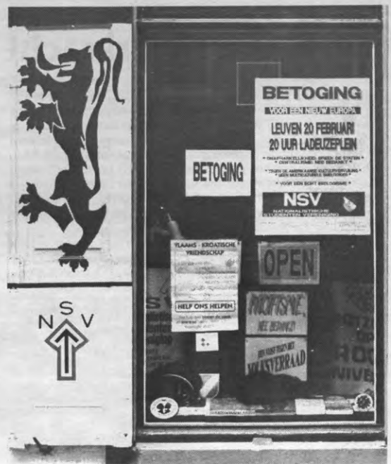
Uitstroom vol onverdraagzaamheid.

Er werd dan maar onmiddellijk besloten om op de OAV zelf geen discussie te voeren over een dossier dat nog onvolledig gekend is, en alles door te verwijzen naar een commissie. Die commissie zal samengesteld worden uit maximum twee afgevaardigden van alle geledingen van Loko. Ze moet zo snel mogelijk een pak informatie verzamelen om terug te sturen naar de kringen. In de eerste plaats moeten de exploitaties van de laatste jaren van alle geledingen worden bijgebracht om een beter zicht te krijgen op de werking, en om eventuele structurele tekorten op te sporen. Ten tweede zal de commissie nagaan hoe de huidige verdeelstapel tot stand gekomen is, wat de achterliggende motieven waren van de opstellers ervan. Tenslotte kan ze ook een aantal concrete denkspites voor een herstructureren uitwerken. Als al deze informatie naar de kringen is gegaan, komt er een nieuwe OAV waar de discussie ten gronde op gang kan komen. (PDG)