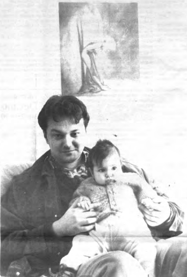
Dochter Jana krijgt felle concurrentie van het geesteskind van haar vader: in minder dan geen tijd is Saint-Amour uitgegroeid tot de grootste literaire happening van het land.

Veto: Dat was ook het onderwerp van de polemiek tussen U en Guido Lauwaert, twee