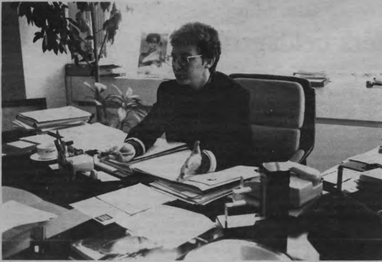
Kijk eens aan! Allemaal Belgisch, tot de kamerplant toe.