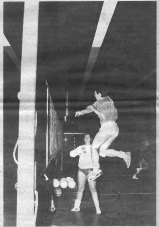
Woensdagavond wordt er op het Sportkot flink wat afgevolleyed. In de namiddag zijn er de bekerfinales, en 's avonds spelen de topklubs Lennik en Roelare tegen elkaar. De kans dat de Westvlamingen het halen is zeer groot. Waarmee hun superioriteit nog maar eens bewezen is. Denken ze. Die Westvlamingen.