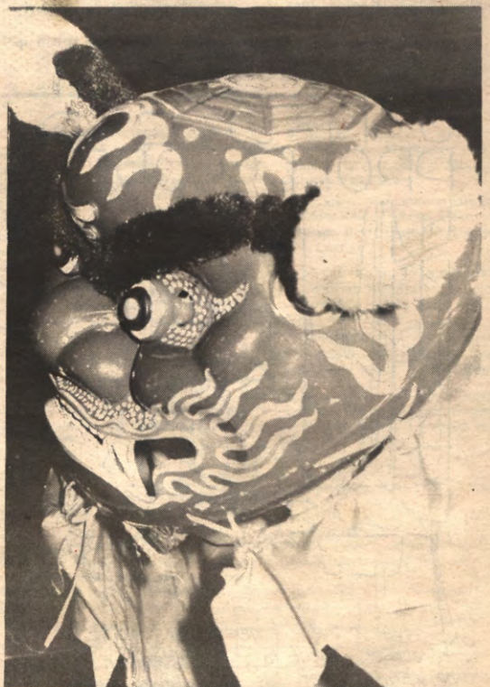
Dit is de Chinese Marlon Brando. We besparen u Raquel Welsh.