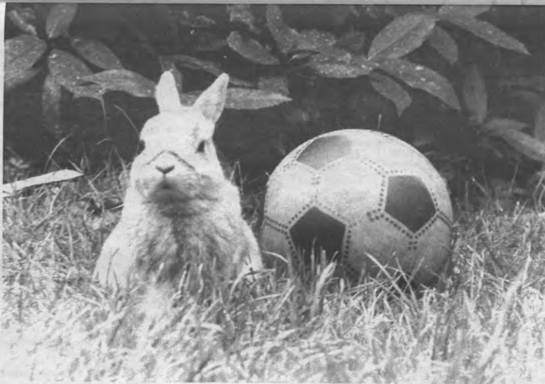
Zoek de door moderne landbouwtechnieken gemuteerde levensvorm in dit idyllische landschap.