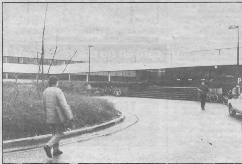
Hoe ongelukkig het ook moge schijnen, op deze foto ziet u nagenoeg een hele unief, studentenpopulatie inclusief.