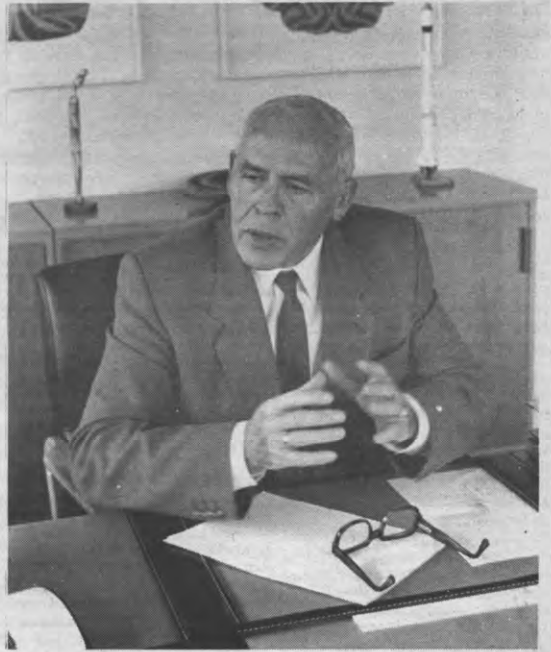
Niet groter dan dat is mijn uniëfke, zie, en dan had ge het moeten zien voor ik kwam!