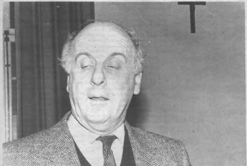
D'AVIGNON: dinsdagavond in Leuven, om te spreken over één van zijn klassieke onderwerpen, en nu al in de Veto. Wat zegt u daarvan!