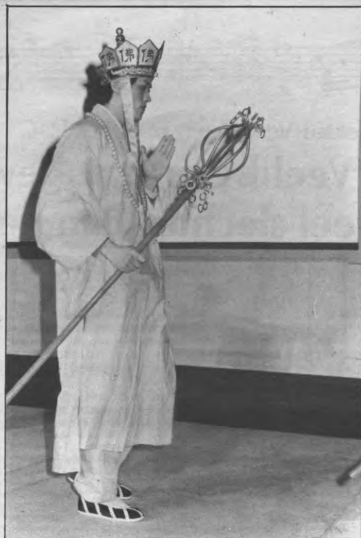
Driekòdòningen, diekòdòningen, geef mij 'ne nieuwe hoed.