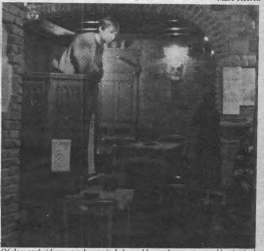
Of de waarheid nog steeds vanuit de kansel komt, kunt u nu met één pint in de hand horen.

Meer informatie is te bekomen bij Karel Lannoo en bij Geert Pauwels, op de tweede verdieping van 't Stuc, E. Van Evenstraat 2D te 3000 Leuven, dagelijks tussen 9.00 u en 18.00 u (016/23.67.75).