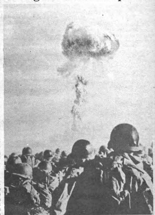
Naar aanleiding van de jaarlijkse vredesweek, die doorgaat van 25 februari tot 1 maart, schreef Prof. Francois een drietal artikelen. Verleden week kon u iets meer te weten komen over de effecten van een kernontplofing op korte termijn. Vandaag heeft hij het over de gevolgen op lange termijn.