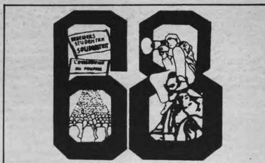
'De verbeelding aan de macht', maar ook medebeheer, demokratisering, politisering. Verdrinkt de '68-erfenis in de nattigheid van het Ik-tijdperk?

Bijzonder in de A.S.R. is de spanning tussen beide visies en de groepen die ze vertolken, merkbaar. De kritiek van de vrije, rechte verenigingen dat de A.S.R. een 'kleine gauchistische minderheid' vormt is in die zin terecht dat de meeste toonaangevende figuren in de A.S.R. kunnen gerekend worden tot de progressief-idealistische vleugel. Zij achten het hun plicht die principes van '68, aan de basis van het ontstaan en de werking van de A.S.R., ietwat levendig te houden onder de studenten, hoewel de pragmatische meerderheid er niet zo warm voor loopt en er eigenlijk nogal huiverachtig tegenover staat, al mag dat laatste niet altijd luidop gezegd worden. Wel is het zo dat sommige nieuwe kringafvaardigden, na het aanvankelijke wantrouwen overwonnen te hebben, overtuigd raken van argumenten van de