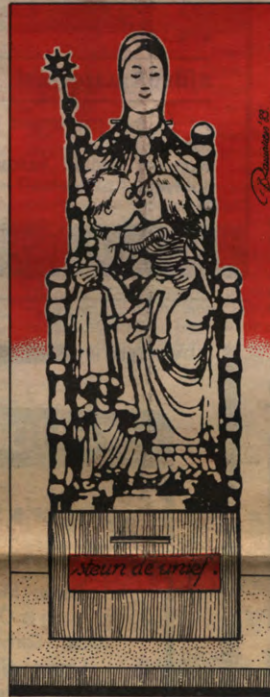
Het ATP en het WP van onze universiteit is het niet helemaal eens met de besparingsmaatregelen van de unief; zij voelen zich zelfs gedupeerd.

Op de bijeenkomst van de L.B.C.-stuurgroep op 10 februari bleek echter hoe moeilijk het was in exacte cijfers uitgedrukt alternatief voorop te stellen. Maar dezelfde verwarring blijkt ook te bestaan bij de academische overheid, om te beginnen t.o.v. welke personeels-kostprijs de faculteiten 6% dienen te besparen, en waarom juist 6%. Als referentie blijkt nu reeds niet alleen sprake te zijn van een theoretische omkadering (wettelijk kader, bepaald door de financieringswet van 1971) en een praktisch kader (het reël bestaande): de academische overheid schijnt een derde interpretatie te hebben, nl. het door hen goedgekeurde kader, wat een zeer manipuleerbaar begrip is. De werkelijke motieven van de academische overheid liggen dan ook elders. Financiële ziet het er voor de K.U.L. immers minder goed uit, dan men op grond van haar nog steeds stijgende studentenaantal zou verwachten, men zit vooral met een tekort aan liquiditeiten («cash-flow»), tengevolge van een lening toegestaan aan de U.C.L., en ten gevolge van de pre-financiering door de K.U.L. van haar bouwprojecten (Gasthuisberg, ...). Sinds 1980 werden de daarvoor beschikbare fondsen immers door de regering geblokkeerd. Om uit haar (tijdelijke?) financiële moeilijkheden te geraken zou de K.U.L. op haar beurt reeds een lening van ± 200 miljoen hebben aangegaan. Bovendien vreest men dat de studentenaantallen de komende jaren ook voor Leuven zullen gaan stagneren, of zelfs afnemen.