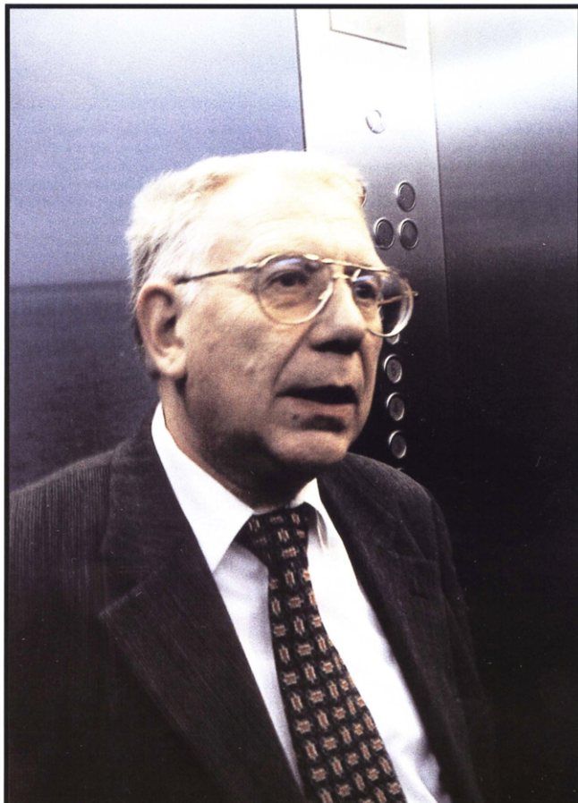
“En ik zeg u dat ge uit mijne lift vliegt.”