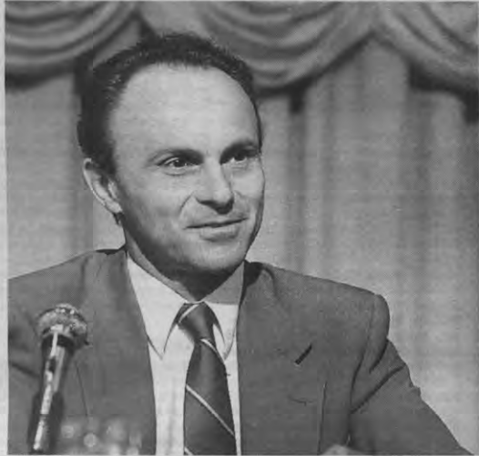
Eén van de vier