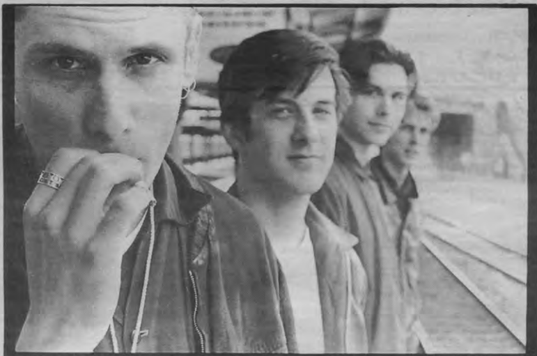
De droom van elke platenbaas