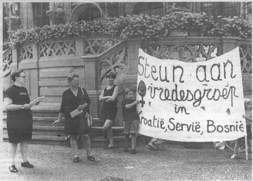
Toen de zon nog scheen