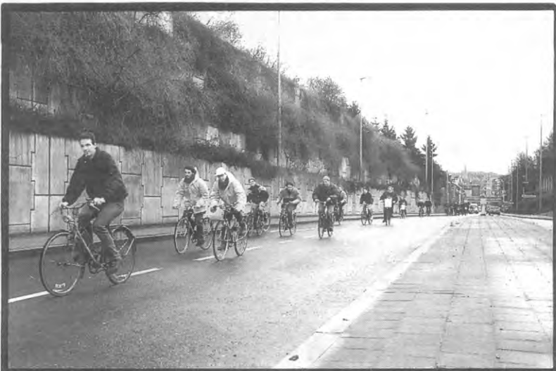
Gert Meesters lag toen al tweehonderd meter achterop