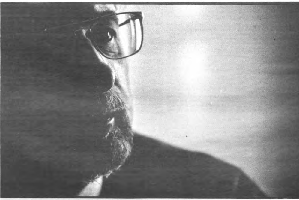
"Ik wil beoordeeld worden op de resultaten"

“t Was vroeger gemakkelijker om naar de kabinetschef van de koning te bellen dan naar die van de burgemeester van Antwerpen.”