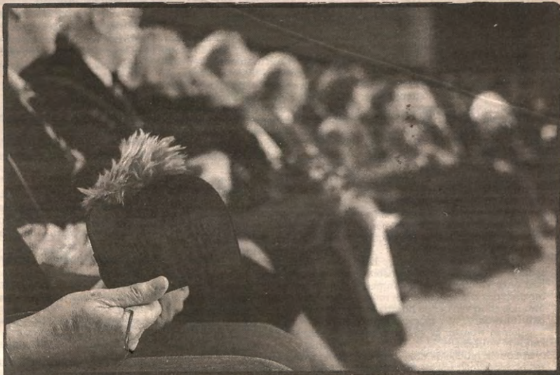
De uitreiking van de eredoktoraten