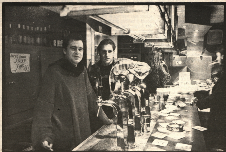
De bodem van het vat is in zicht.