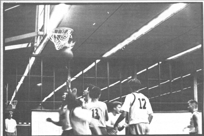
Sportief en toch niet gek

Lisst '94 opent dit jaar voor de elfde keer de poort voor zo'n zeshonderd buitenlandse studenten om een week lang de sportvelden en fuizalen te bevolken. Ook dit jaar wil Sportraad de Leuvense student zo veel mogelijk betrekken in de meest eksotische week tussen de Oude Markt en het sportkot. Daarom doet Sportraad beroep op de rest om mee te helpen in deze mastodontenorganisatie. Als je er wat voor voelt om van 28 februari tot 4 maart een aantal buitenlanders onderdak te bieden op je kot of ze een week wegwijs te maken door de studentenstad, aarzel niet en spring even binnen op ons sekretariaat op het sportkot om je naam op te geven. Laat je niet afschrikken: de buitenlanders moeten zelf voor luchtmatrassen en slaapzakken zorgen. Vluggе beslissers kunnen nog kiezen wie ze op hun kot willen. Wie een gespierde atleet in bed wil, rept zich meteen naar Tervuursevest 101 in Heverlee, tel. 20.62.03.