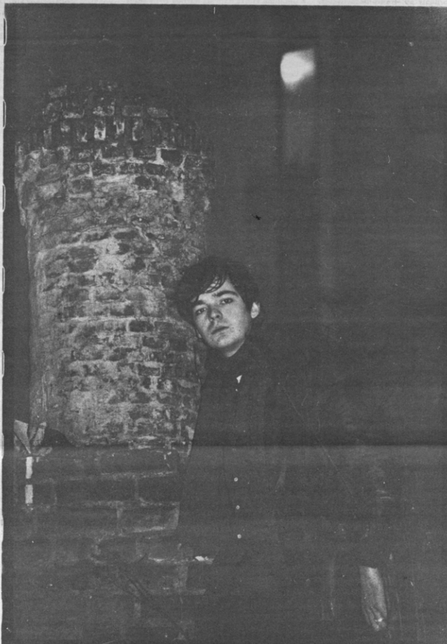
"Niets zo prachtig als de ijzeren wet van het publiek."

«Zouden er geen subsidies zijn, dan zou de helft van alle acteurs waarschijnlijk direct stoppen met spelen. Alleen de kern zou overblijven. Wat heeft toneel uiteindelijk te maken met koel-