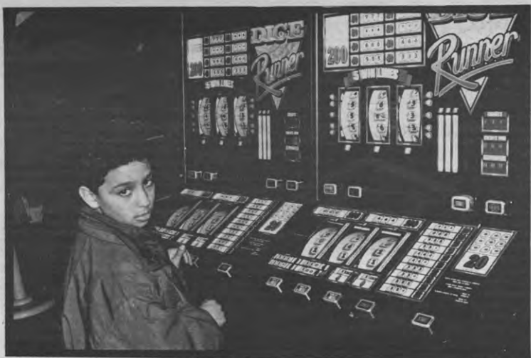
Als dat geen pseudo-wereld van leeg amusement is

Hij gaat tekeer tegen de 'bewustzijnsverruiming' bij het grote publiek dat alleen nog maar gevoeld wil worden door oppervlakkige spelletjes. Dat staat een democratisering van de