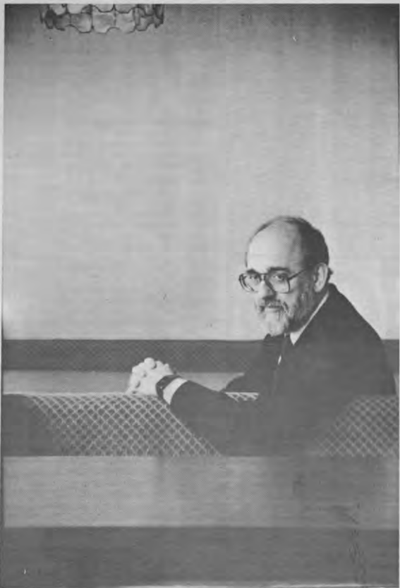
«Ik ben een 'thirtist floor optimist'»

Hamelink: «Dat is natuurlijk waar, maar als men zich té veel gaat beperken tot het lokale niveau dan is het gevaar reëel dat men uit het oog verloest dat de lokale ontwikkelingen ook voor een groot deel bepaald worden op een hoger niveau. De slag om de lokale kulturele ruimte kan niet alleen lokaal gevoerd worden. Niet Goever- nementeले Organisaties van niet-industriele