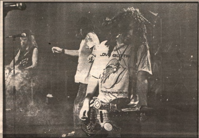
Punk — Vorige week zondag konden de punkers hun hart ophalen en het krakende geluid van hun platen even opzichschuiven voor een oververdoend concert. Inderdaad U.K. Subs. Wij gingen babbelen met Charlie Harper en kwamen terug met een illusie rijker. Hij heeft helemaal geen hanebam (hij heeft dreadlocks), is niet stomdronken of stoned, en heeft geen haarspelden door zijn neus. Wie zet weer dat punkers marginaal zijn.