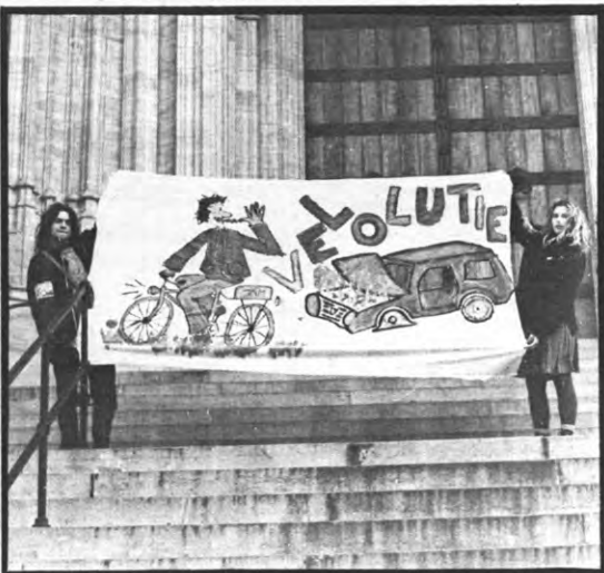
Steek ook eens een tong uit naar een meisje