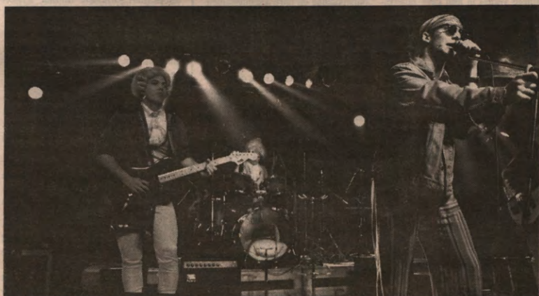
SONGFESTIVAL - Binnenkort mogen de aankomende rockgoden van de KUL weer hun duivels ontbinden op het podium van het jaarlijkse kampioenschap musiceren van de Landbouwkring. De groepen, het circuit, de roadies, de drugs, de motels, het geld: diven naar pagina 9.