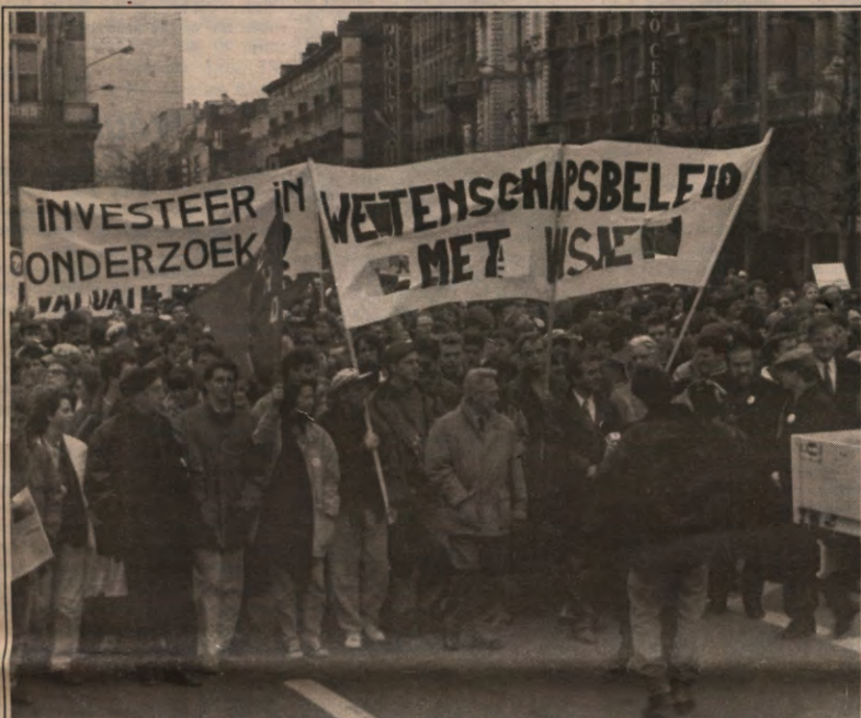
GRIJZE WOEDE - Vorige donderdag betoogden meer dan vijfduizend assistenten, profen en studenten samen tegen de verdwijning van het wetenschappelijk onderzoek in Vlaanderen. Veto trok naar Brussel, kieke de massa en legde zijn oor te luister bij zij die zichzelf tegenwoordig 'een met uitsterven bedreigde soort' noemen: de onderzoekers. Anderen bleven thuis en rekenden op ons verslag. Het is er, en wel op pagina 3.

STUDENTENWEEKBLAD VAN DE LEUVENSE OVERKOEPELENDE KRINGORGANISATIE - JAARGANG 18, 1991-1992, NUMMER 18, MAANDAG 10 FEBRUARI 1992