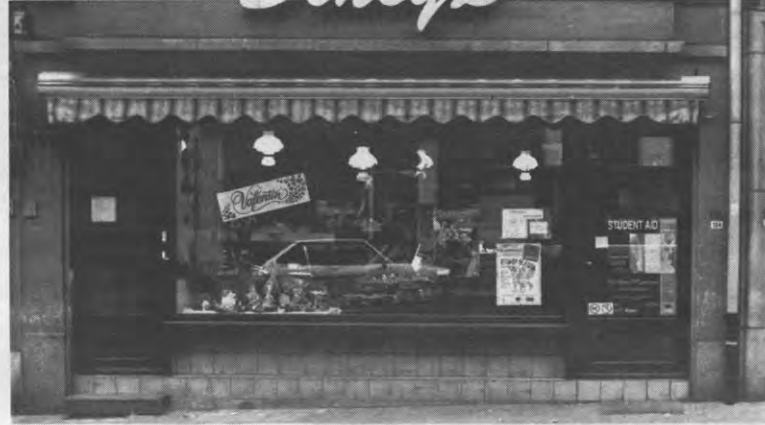
De verdediging van de middenstand was een belangrijk element in het antisocialistisch discours.