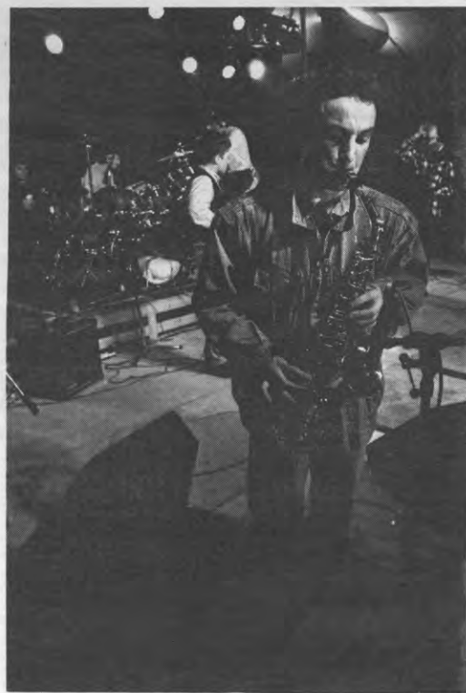
Elke keer als ik die wilde sax hoor...

De formule van happenings waarbij de kringen het tegen elkaar opnemen moet normaal garant staan voor succes. Getuige bijvoorbeeld de massa-akties van Sportraad (vierentwintig uur). Vorig jaar was door de gebrekkige busdienst en door het weer (er lag 10 cm sneeuw) het songfestival in duigen gevallen. Ook de verwarming was toen een probleem. De generatoren bleken niet genoeg stookolie te hebben om de hele tent van verwarming en elektriciteit te voorzien. Maar