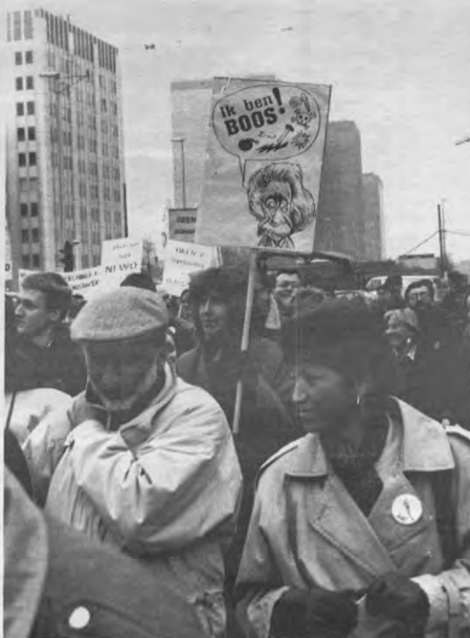
De woede van de wetenschappers is allesbehalve relatief.