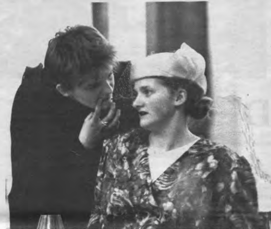
Seks, drank en mannen vormen de spil van hun bestaan.