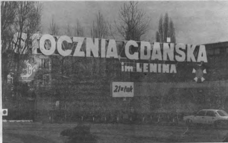
De ingang van de Lenin-scheepswerf in Gdańsk, waar Solidarność tien jaar geleden wortel schoot.