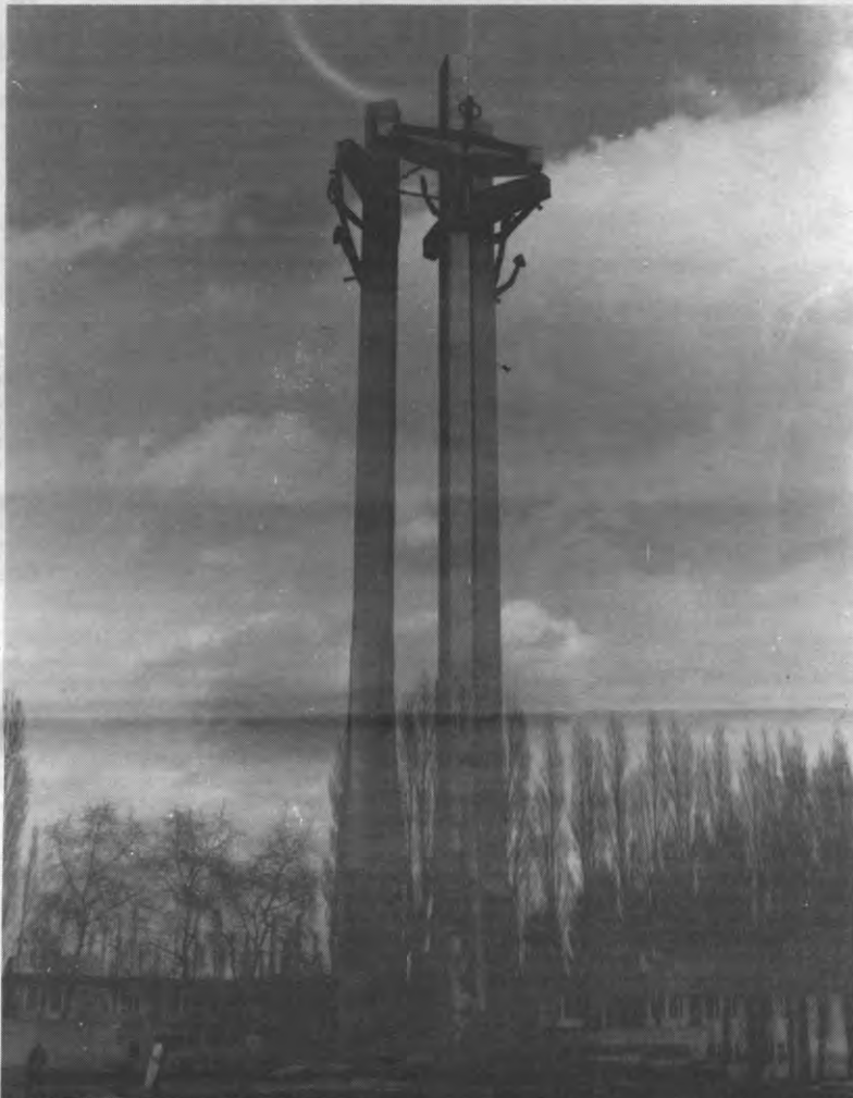
GDANSK - Monument voor de gevallen Poolse arbeiders.

Maria mag dan al razend populair zijn, toch ondervindt haar kultus scherpe concurrentie van de nationale monumenten en gedenktekens. Ieder kerkgebouw heeft wel een altaar "voor de helden van het vaderland", compleet met Poolse vlag, verse bloemen en brandende kaarsen. Hele afdelingen van wat wij een jeugdbeweging noemen, defileren voor die altaren en brengen een soort van Romeinse groet. Polen, echte Polen, horen bij de Kerk, en de Kerk verdedigt de Poolse zaak, zoveel is duidelijk.