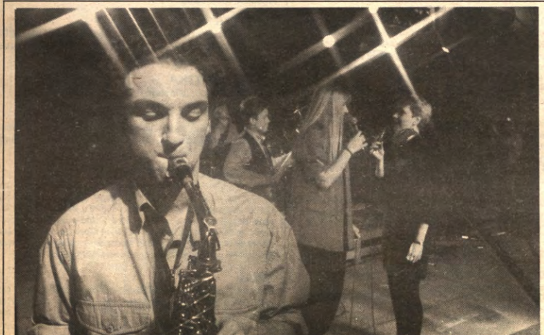
BOEREKOT - Over de achtste uitgave van LBK's Interfakultair Songfestival, dat vorige week doorging, bericht Veto op pagina 9.