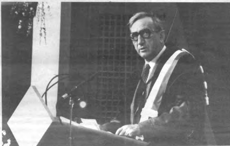
Mazowiecki, premier van 40 miljoen lui mensen?