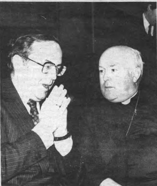
DE LEEK in de Kerk is de helft van de charme, zo blijkt.