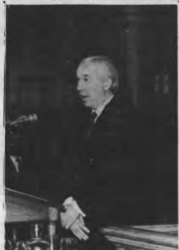
Christian de Duve hield op de akademische zitting een lezing onder de titel: "Vers une deuxième révolution médicale."

Toch was het een vrij aanzienlijk groepje dat iets na tien begon aan het originele opzet. De aktie bestond er immers uit in groep de Naamsestraat op de voetpaden te bewandelen. Bij de universiteitshallen en aan het oud ateneum werd via het zebrapad overgestoken om aan de andere straatkant dan terug te keren. De groepsoversteken zorgden steeds voor enig verkeersoponhoud. De politie probeerde dan ook de aktie uiteen te trekken. In dit opzet lukten zij niet helemaal omdat de kleine groepjes die reeds overgelaten waren steeds wachtten tot het geheel het zebrapad over was. Toen het duidelijker werd dat de aktie vreedzaam zou blijven, gingen de agenten wat diskreter te werk.