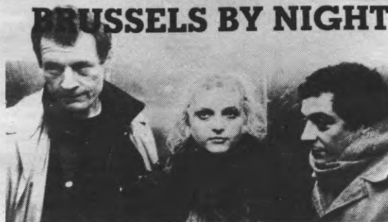
Het overzicht van de Vlaamse film sinds 1960 is uiterst up-to-date in dit boekje: zelfs Brussels by night is erin opgenomen.