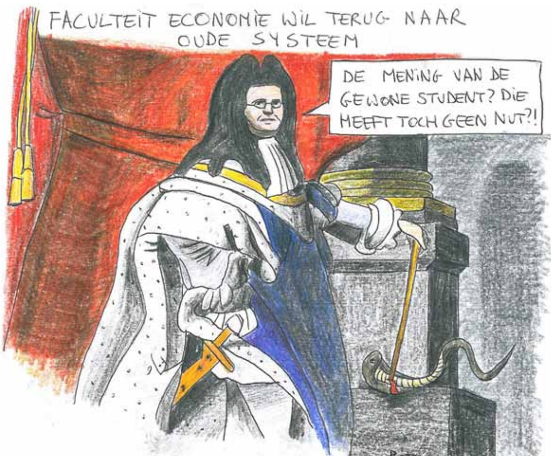
CARTOON Pjotr Hubin

faculteit net de Equis accreditatie gekregen, die ook vele andere economische topinstellingen hebben," vult de preses aan.