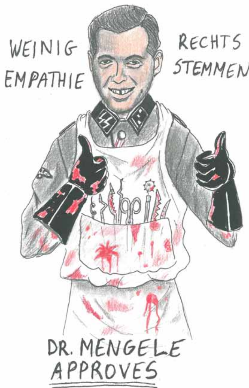
CARTOON Martijn Stoop

Bovendien merkt Finn op dat studenten vaak zelf actief op zoek gaan naar dergelijke opportuniteiten. "Ik zou dus niet te veel conclusies koppelen aan het opiniestuk van De Maeseneer. Hij wil vooral de discussie openen."* Olivia en Sacha zijn fictieve namen