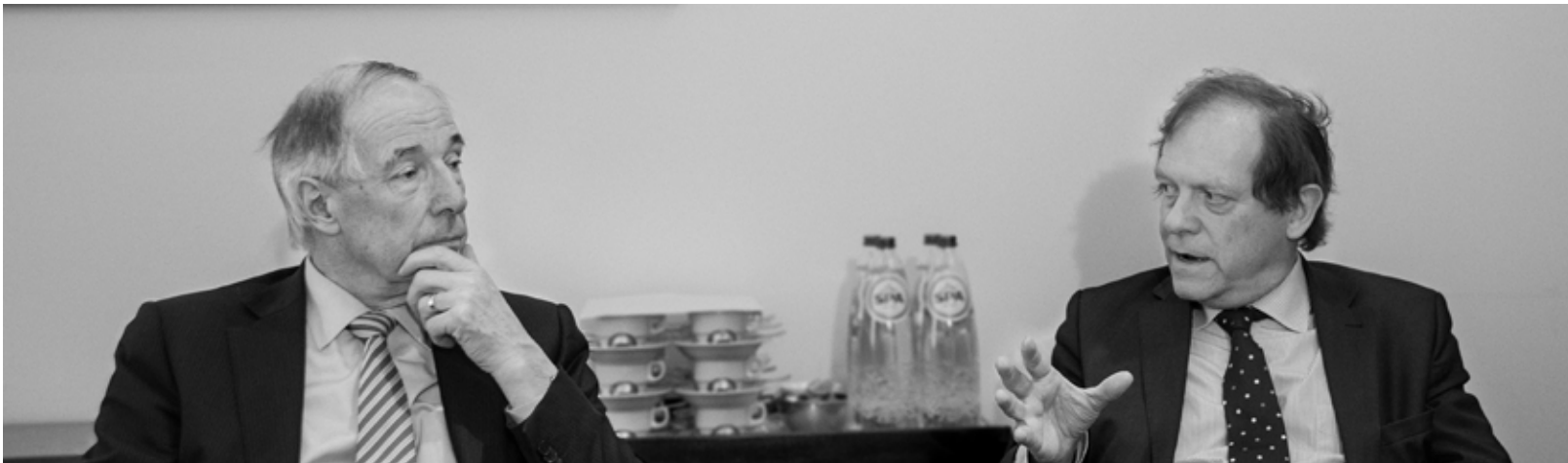
Vanaf maandag 7 maart wordt Veto verspreid over alle campussen van de KU Leuven. Voor deze starteditie hebben we een campusdossier opgesteld (zie pagina 12 en verder). Daarin kunnen de twee grote beziers van het campusverhaal niet ontbreken.