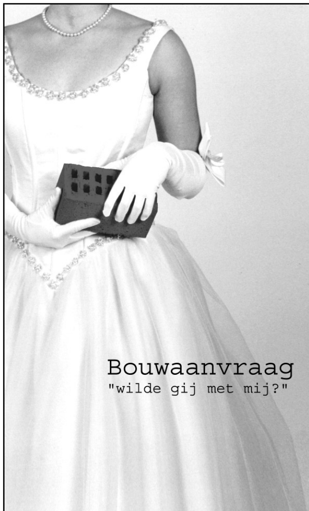
Bouwaanvraag "wilde gij met mij?"

vertaler zijn van vorm en ruimte, en dit in twee richtingen: architecten moeten de taal van de klant begrijpen én deze door krachtige architectuuringrepen omzetten in een mooiere taal, die door beiden begrepen wordt.