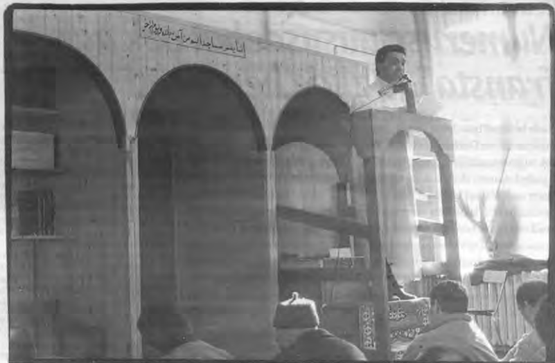
Middel tot het bereiken van politieke en economische doeleinden?

De confrontatie tussen onze cultuur en de islamtraditie leidt tot verscheidene probleemsituaties, zoals bijvoorbeeld de hoofddoekaffaire. Het dragen van de hoofddoek door Moslimmeisjes leidde tot problemen in het onderwijs, eerst in Frankrijk en later ook bij ons in België. De vraag omtrent "le part de signes d'appartenance à une communauté religieuse est ou non compatible avec le principe de laïcité" is en blijft nog steeds een discussiepunt in verschillende scholen. Over dit probleem is slechts weinig terug te vinden in de Koran. De 'hadith' (traditie) legt de nadruk op eenvoud en het vermijden van strakke kleding die het buigen tijdens het gebed bemoeilijkt. Door het hoofd te bedekken betuigt men eerbied voor Allah's engelen, die symbo-