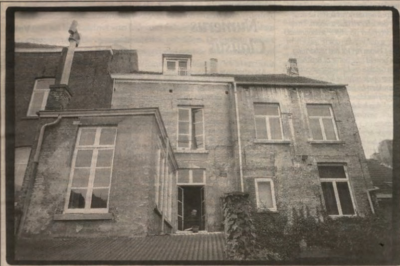
Veto opent een raam op proefdieren, dossier op pagina's 5-9.