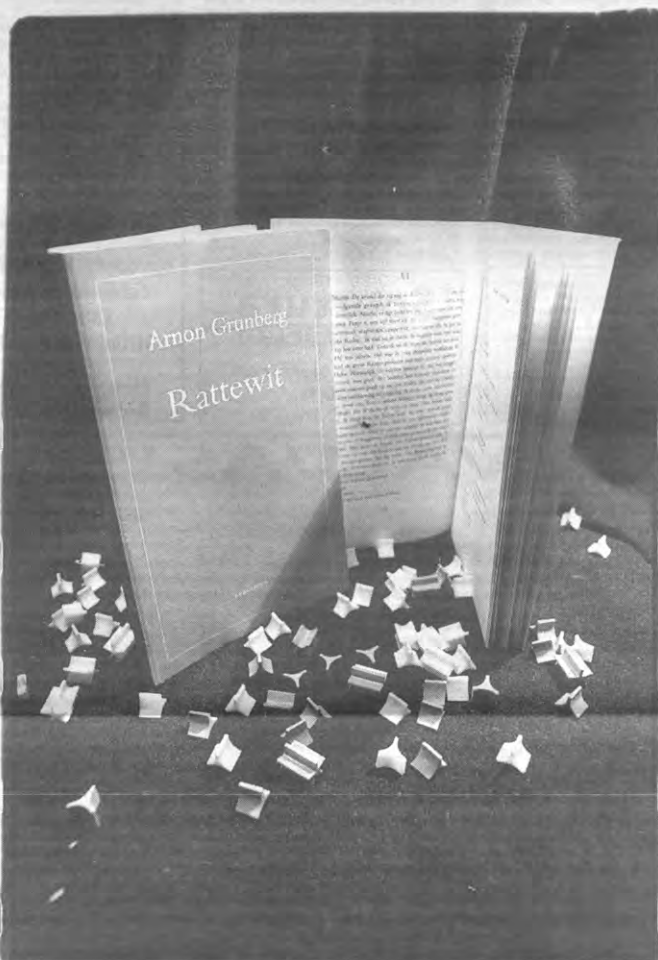
Het stuk is allerminst grappig

Het stuk speelt zich af in een kafee naast een joodse begraafplaats, waar zonet de vader van Michael is begraven. En wat er zich dan afspeelt in dat kafee, dat zijn discussies. Twistgesprekken tussen Michael, zijn moeder Hanna en Ginger Cobi, een toevallige bezoeker. Trialogen