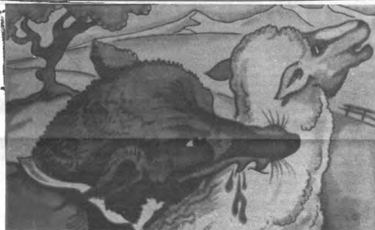
Reynaert: gaandeweg een soortnaam voor elke vos geworden.