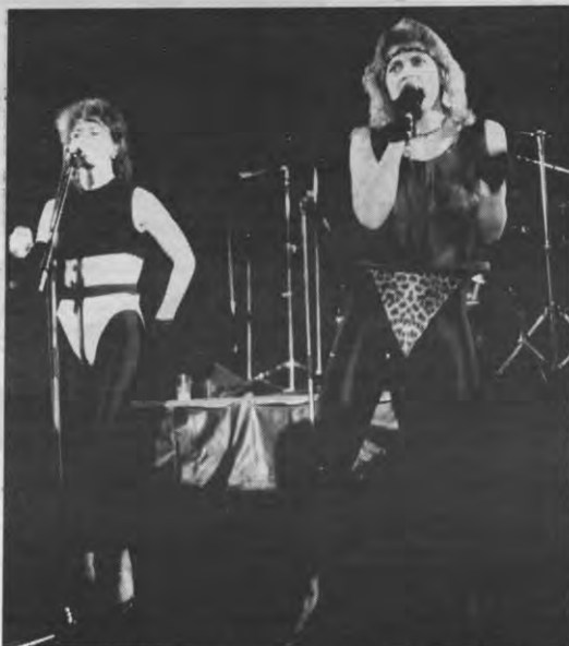
SONGFESTIVAL - Twee jaar geleden kon u deze lieflijke dames aan het werk zien op het door Landbouwkruis georganiseerde Interfakultaire Songfestival. Dit jaar passeert het schoons de revue in een zevende editie in een reuzetent op het Sportkot. Er worden 3000 kijklustigen verwacht. De zeven kringen die de preselectie doorspielden, treden er voor u aan op dinsdag 30 januari, om 20.00 u.

«Over die kwestie zijn al honderd en meer rapporten verschenen, en ze hebben allemaal een verschillende conclusie. Ook binnen Medika zijn de meningen daaromtrent verdeeld.»