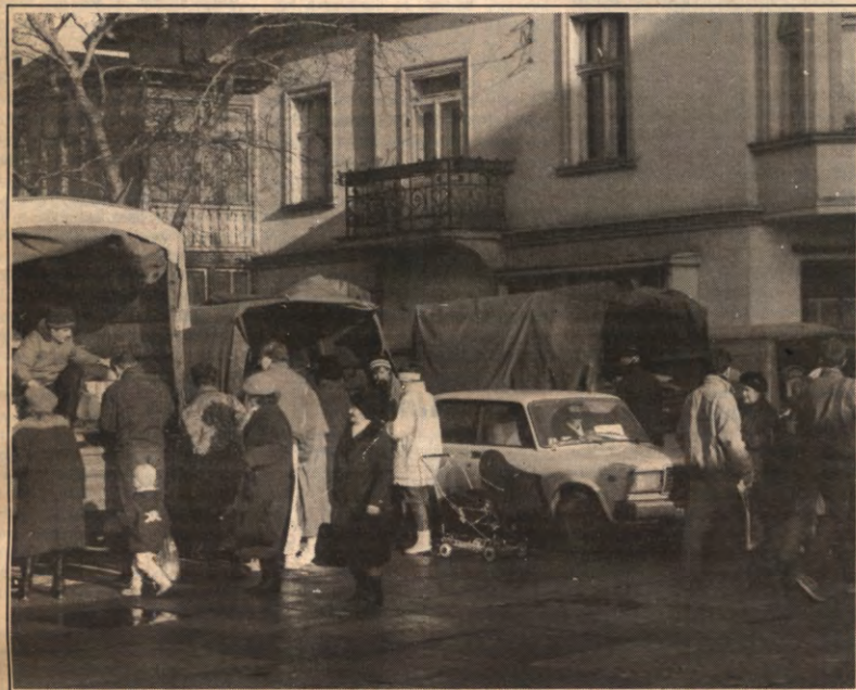
SOLIDARNOSC - Neen, u vergist zich, dit is niet de wekelijkse donderdagmarkt in Sint-Niklaas of Lokeren, dit is een sfeerbeeld uit Polen dat onze reporters voor u meebrachten. Ter gelegenheid van het eredoctoraat van Mazowiecki reisde een Veto-team een hele week door Polen, praatte er met onder andere Lech Walesa en al er in de duurste restaurants van Warschau. Volgende week en de week daarna leest u in Veto alles over Poolse studenten, gelovigen in Bratislava, de verering van de Heilige Lech, de puinhoop van de economie, en autopannes.

STUDENTENWEEKBLAD VAN DE LEUVENSE OVERKOEPELENDE KRINGORGANISATIE - JAARGANG 16, 1989-1990, NUMMER 17, MAANDAG 29 JANUARI 1990