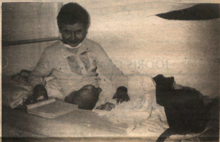
Een Palestijnse jongen in een ziekenhuisbed. Een 'high-velocity-kogel' uit een Israëlisch geweer kostte hem z'n been.

Er zijn van die mensen - wij persoonlijk hebben er een grondige hekel aan - die nooit op tijd kunnen komen. Neem nu die Brailovskis: krijgt in eredoktoraat in 1981 en verwaardigt het zich acht jaar later om dat eindelijk eens op te komen halen. Maar kom, wij zijn breeddenkend en vergevingsgezind. Laat de champagne aanrukken op pagina 7.