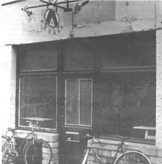
Dit pand gaat binnenkort dicht. Maar als u een dezer dagen toch niks beter te doen hebt, kan u er misschien toch eens binnenwippen. Ze draaien er Suzanne Vega, en er is een put van — tuuuuu — om te dempen.

De brouwerij (Stella) en de huisbaas (het huis wordt voor 9000 per maand