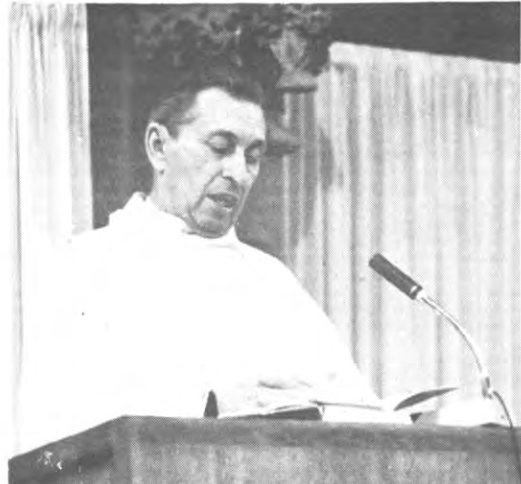
Het is wellicht een akademisch vraagstuk. Maar zou het taalkundig eigenlijk niet verantwoord zijn om dit heerschap Stoepmans ipy Daelemans te noemen? Of wat dacht u van Drepelmans? Het leven is toch een yreemde bezigheid, nietwaar?