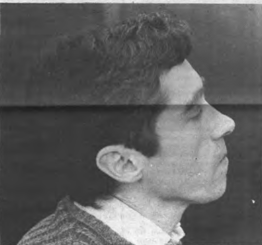
Wel, als je met je neus in de lucht wil kijken, doe het dan.