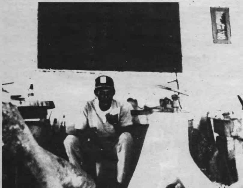
Meestal zijn de granja's abiertas boerderijen zonder omheining die midden in bossen of velden zijn gelegen. De constructie en inrichting van deze boerderijen zijn zeer eenvoudig.