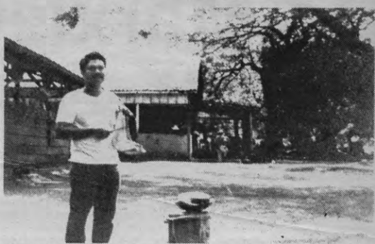
Het granja-principe doet beroep op eigen verantwoordelijkheid. De dagelijkse leiding is in handen van één van de gevangenen zelf, iedereen heeft een eigen taak.

In totaal zijn er twee granjas met een open systeem en vijf met een half-open systeem. Het verschil tussen deze twee systemen is er slechts een van bewaking. In de half-open granjas zijn er meer verantwoordelijken van het penitentiair systeem aanwezig, afhankelijk