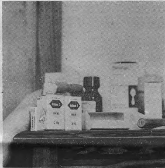
Niet alleen tijdens de examenperiode ziet het nachtkastje van sommige studenten er zo uit.

Veto: Zij gaan nog meer studeren omdat ze weinig sociaal contact hebben.