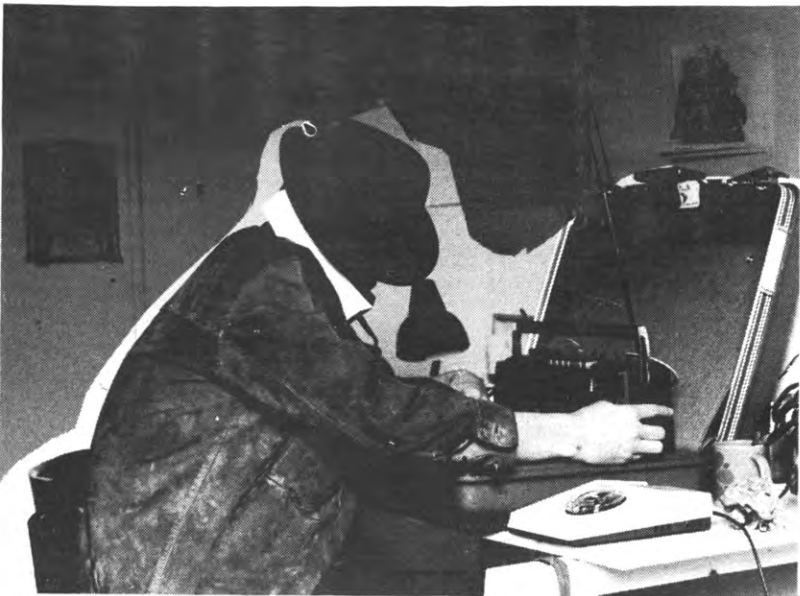
Als het wetsvoorstel van Gol op de privacy er doorkomt, wordt negentien vierentachtig negentien eighty-four.