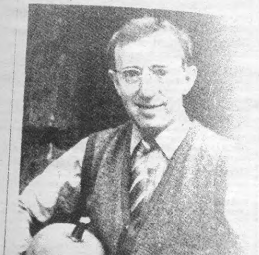
Woody Allen in Zelig . Een film waar inventies als buitenlandse stem, dubbing, tussen- en ondertitels druk bezichtigd worden. Aldus Bruno Verpoorten.