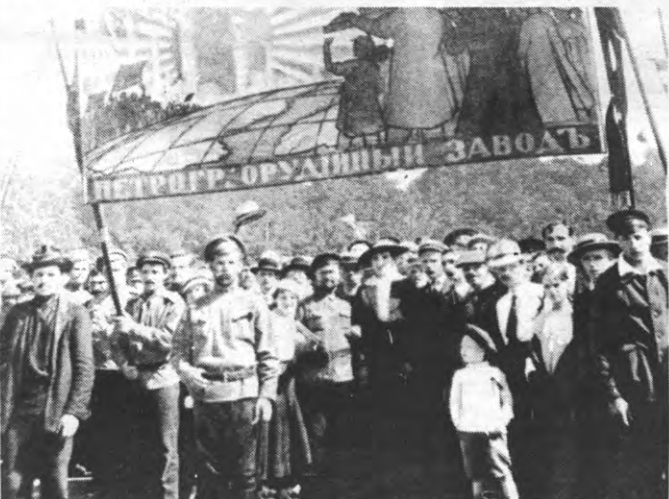
Massamanifestatie. Voor de linkse beweging nog steeds het ideale aktiemiddel. Helaas al te dikwijls in functie van een bepaalde ideologie.

te formuleren, dan wordt het even concreet als Sint Augustinus in 'De Civitate Dei': zodra het dan ook de macht veroverd heeft, blijkt dat zijn verklaringsmodel is uitgeput: de kompleksiteit van de werkelijkheid herneemt zijn rechten en keert zich al vlug tegen het naïeve entoesiasme van de nieuwe machthebbers; het revolutionaire front brokkelt af, de stootkracht verdwijnt en uiteindelijk kunnen de rebellen van gisteren de pas verworven macht slechts behouden door zich te ontpoppen als de nieuwe tirannen. Tirannen die zoveel en zoveel erger zijn omdat zij zich op geen enkele traditie, geen enkel ingeworteld ge-