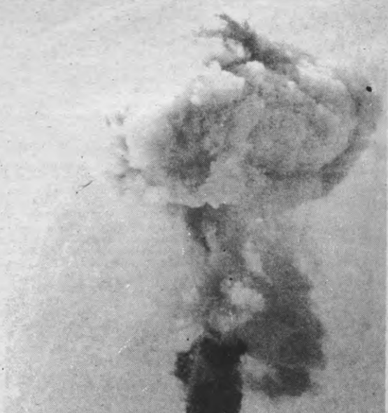
The Day After... Meyers weekendfilm die een kleurtje geeft aan de vredesbeweging. Een atoomoorlog is overleefbaar, heet het. Intussen staat een Engelse firma aan de uitgang van de filmzalen reclamefolders uit te delen voor beschermende pakken. Deze firma volgt namelijk de vertoningen van de film in heel Europa en maakt folders in de gepaste taal. Als de film de vredesbeweging dan niet helpt, de (oorlogs)industrie vaart er wel bij.

Mijns inziens echter blijft 'The Day After', ondanks al zijn goede bedoelingen, een oppervlakkige, en in die mate ook typische Amerikaanse produktie. De bom, die de Amerikanen in de film treft, is voor de meesten ginder niet enkel shockerend in zoverre de gruwelen in de film hen troffen, doch ook, en misschien wel vooral mag niet uit het oog verloren worden dat de Amerikanen nog nooit gekonfronteerd zijn geweest met bombardementen op hun grondgebied. De focus wordt (en blijft) dus gericht op de