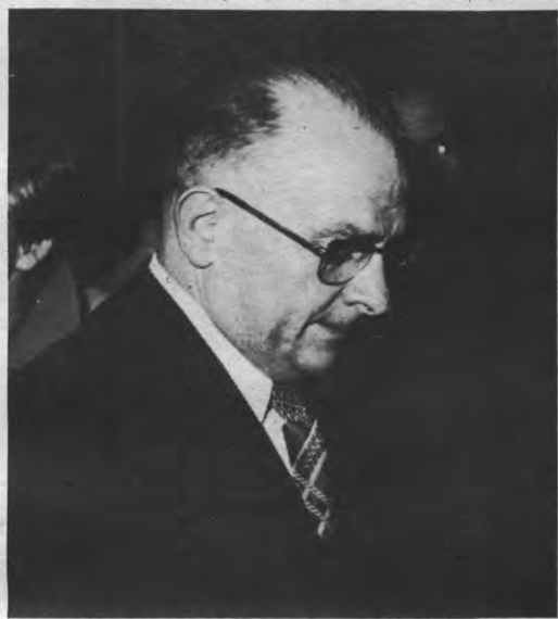
Vansina: gaat artikels 14 (vrijheid van meningsuiting), 18 (Persvrijheid) en 19 (opdracht tot bewaring van rust & orde) te buiten. Het zal je Leuven maar wezen.

(ter bevordering van het bewaren van de orde op de openbare wegen) is voor mij reeds een eerste aanwijzing dat het hier gaat om regelende maatregelen die de rechten en vrijheden zelf niet aantasten, doch enkel hun ordelijke uitoefening waarborgen. Bovendien is het ook zo dat voor een reglement niet alleen de letter tel maar nog meer de geest. De toepassing zal derhalve ondubbelzinnig duidelijk maken wat de feitelijke bedoeling is van het reglement."