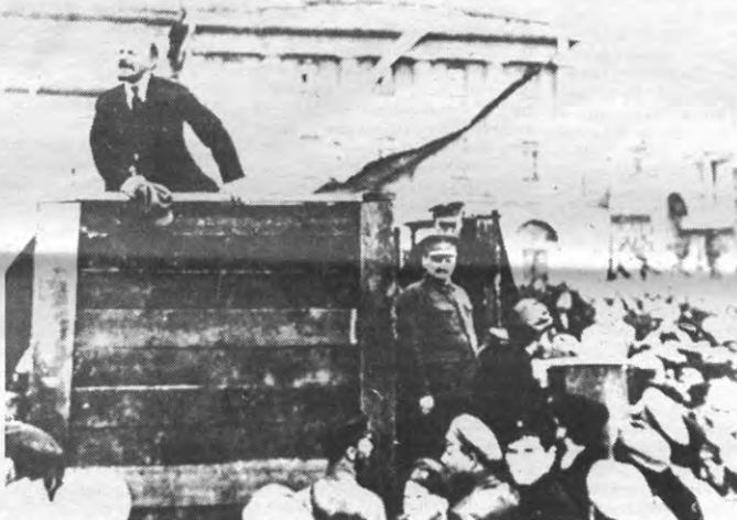
Lenin spreekt de massa toe. Meer dan 50 jaar later fungeert hij nog als een van de boegbeelden van vele linkse partijen.

Nochtans is er een verklaring: het marxisme funktioneert prachtig zolang het kan volstaan met het analyseren van de fouten van de tegenstrever; als het echter een alternatief dient