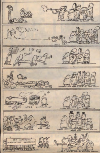
zijn de studenten baldadig ?