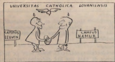
Ons Leven 1968

lijke UCL-studenten waren uit arbeidersgezinnen afkomstig. Toendertijd lag dat voor de KUL al 14,6% en 3,5%. Ook zou door de overheveling het niveau van de huurprijzen zakken en zou de overheveling een efficiënte sociale politiek vanwege de KUL, gericht op de werkelijke belangen van de Vlaamse studentengemeenschap, mogelijk maken.