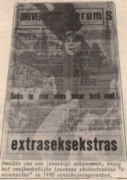
Omville van een (ernstig) seksnummer; kreeg het onafhankelijke Leuvense studentenblad "Universitas" in 1970 verschijningsverbod.