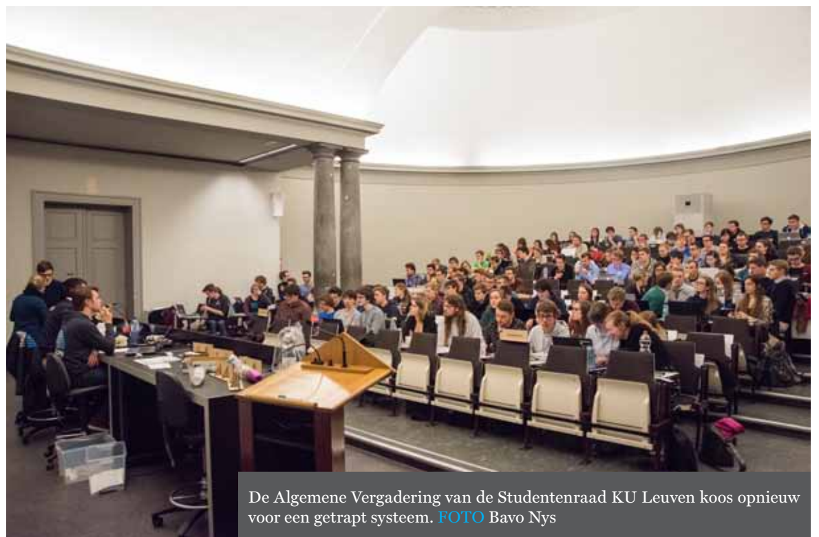
De Algemene Vergadering van de Studentenraad KU Leuven koos opnieuw voor een getrappt systeem.

(Zelfstandig Academisch Personeel, red.), dat zal waarschijnlijk rond 240 liggen," verduidelijkt Gevaert.