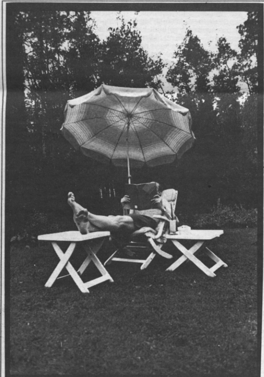
Proefexamens blokken, ach, het is allemaal maar een kwestie van de juiste kontekst, zoals onze medewerker hier op effectieve wijze illustreert. Tip van onze man voor zijn rakkertjes: ter stimulering van het denkproces kunnen een beetje vuile voeten wonderen doen. Maar dat kunnen de lieflijke dames van onze hostgroep ook. Onze man zijn drankje verserven, zo ver willen ze echter niet gaan. Zijn voetjes, zo vermoeden wij.