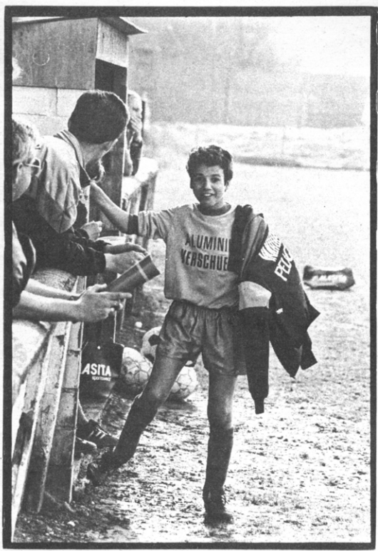
Migranten beheren zichzelf

In normale omstandigheden zouden NCV en Tint vlot moeten samen-