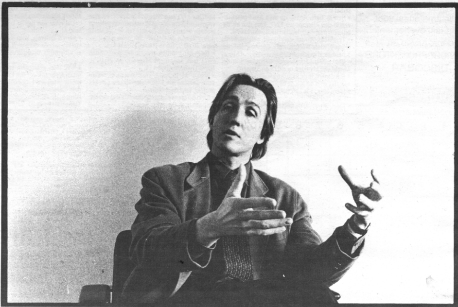
De grote leegte van de hoge cultuur