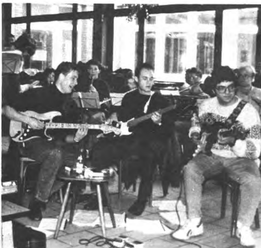
Oefenen voor musical én songfestival: van ekonomie gesproken.