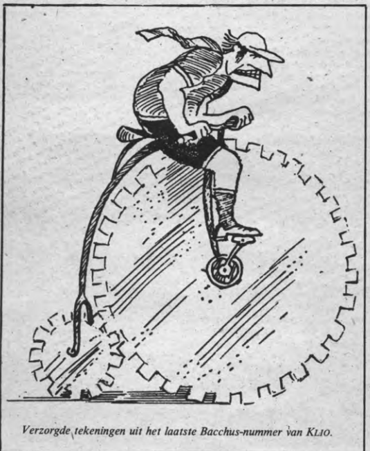
Verzorgde tekeningen uit het laatste Bacchus-nummer van Klio.