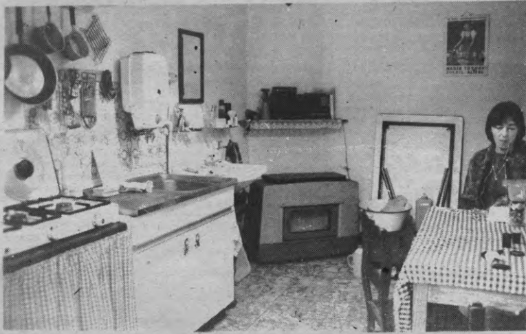
Het huren van een kot zou heel wat prijziger kunnen worden met de nieuwe huurwet; de risico's worden ook groter...