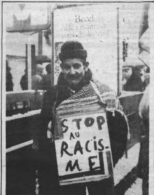
De protesten tegen het wetsontwerp Gol over de immigranten konkreiseren zich zondag in een nationale manifestatie. Daartoe werd opgeroepen door de verschillende vakbonden en een groot aantal studentenorganisaties. Tussen de 3000 (bron: rijksrecht) en de 8000 stapten mee op in deze betoging. Vreemdelingen en Belgen solidair naast elkaar. Rekening houdend met het slechte weer, is dit een meer dan behoorlijke opkomst. De buitenlander op de foto laat zich het weer alleszins niet aan het hart komen. Ondertussen staat vast dat er in februari nog een aantal mensen op Brussel komen. Daarmee hoopt men het ontwerp Gol in de koelkast te kunnen houden.