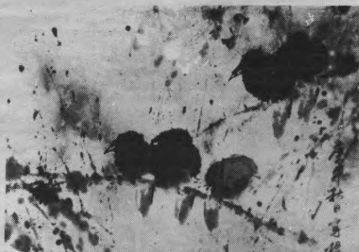
Moderne kunst in China: "twee vogels op een tak"

De taoïsten geloven in het geluk op aarde, in het herwinnen van het paradijs door een natuurlijk, authentiek en eenvoudig leven en het zich ver houden van alle abstracte denken, cultuur en wetenschappen. In de eerste plaats al omdat het tao niet rationeel kan doorgedrongen worden. Alleen in de