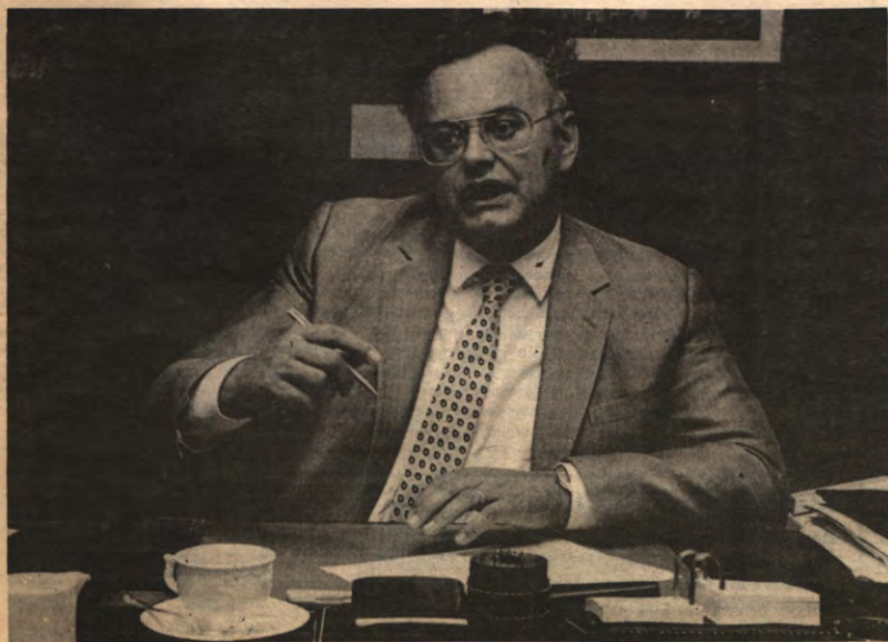
Coens was verleden week in Leuven voor een debat, op uitnodiging van CDS. Veto miste dit evenement, maar... toch een kiekje van onze Minister van Onderwijs.

«Wel is het zinvol om binnen elke (vervolg op p. 3)