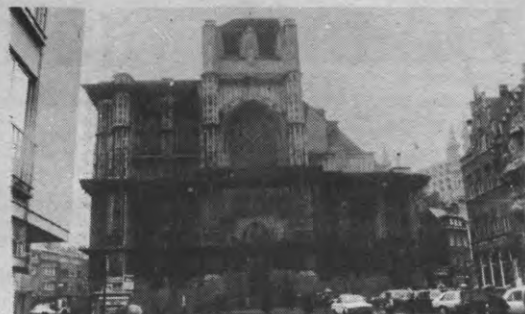
Sint-Pieterskerk Leuven: aangetast door steenanker.

Tijdens de restauratie van het stadshuis heeft men heelwat stenen en beelden moeten vervangen, omdat op het einde van de 19 e eeuw 'te zacht' materiaal is gebruikt, tijdens de grote restauratie die toen plaatsgreep. Volgens Van Herck moet men bijna huis