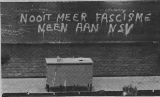
NSV: het Vlaamsche heir staat immer pal...

een onverdiende publiciteit. Zwijgen daarentegen biedt hen de gelegenheid nog schaamtelozer op deze tendens in te spelen.