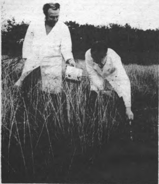
Onderzoek in Kempische vennen: het eko-systeem verandert.

Volgend jaar zijn we te gast in Gent. Hopelijk zijn ze daar betere gastheren (-vrouwen) als gasten. □