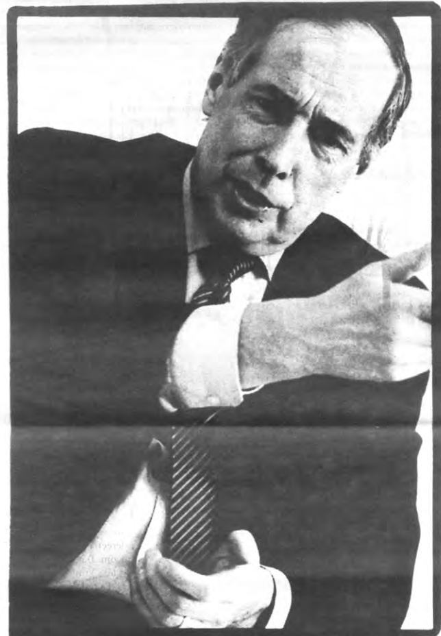
't Is moeilijk bescheiden te blijven, wanneer je zo'n bink bent als ik

ons maar met de Kulak beginnen. De Kulak is een kampus van de KU Leuven, dat wil zeggen dat wij dat in extra kost nemen. De kostprijzen van het geheel ligt uiteraard in de licenties omdat daar het onderzoeksgehalte het grootst is. Moest de Kulak niet door Leuven worden gefinancierd, dan zou ze drie keer zo duur zijn. Ik denk niet dat het een probleem is dat de universiteiten meerdere kampussen hebben. De KUB is een apart verhaal.»