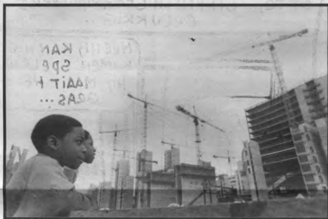
Is dit het vredeseiland waar zij van dromen?

Het campagneweekend loopt dit jaar van 14 tot 16 januari (vrijdag tot zondag). Voor algemene informatie: http://vredeseilanden-coopibo.ngonet.be . Wie tijdens de drie dagen een handje wil toesturen, is altijd welkom bij Paul Wauters, tel. 016/89.45.92 of 0486/76.39.89.