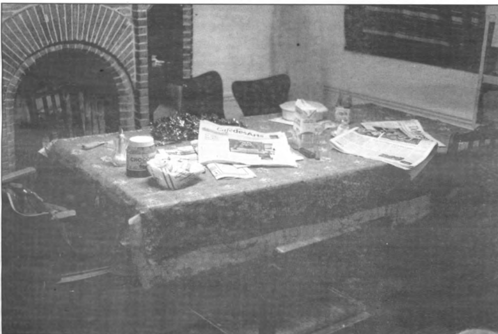
Precies de tafel van PVDK