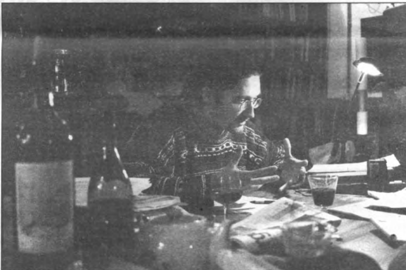
De vloeiende nieuwe politieke cultuur est arrivée?