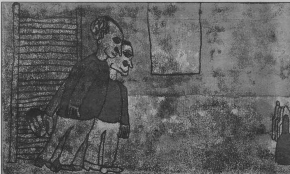
Ivan Braems, 'Kegelspel', 1993