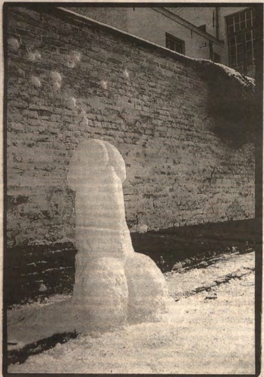
Van den Bossche wit van woede? De verschrikkelijke sneeuwman? Toe pee of not to pee? Toback krijgt toch standbeeld? Hoe dan ook, Koning Winter zwaait z'n scepter over Leuven. En dus kon u deze robuuste jongheer vrijdag bewonderen bij Alma 2. Tot een mooi middagzonnetje voor impotentie begon te zorgen. Wees echter getroust, 't kan ook psychologisch zijn.