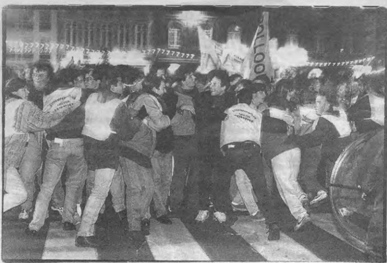
Tweeduizend onwillige betogers worden door de mensen van Loko naar het station geduwd.

Na het succes van Shadows trok Cassavetes naar Hollywood, een avontuur dat niet goed afliep. Hollywood kon Cassavetes niet de vrijheid garanderen die hij nodig had om de films te maken die hij voor ogen had. Na enkele flops begon Cassavetes te sparen voor een nieuwe onafhanke-