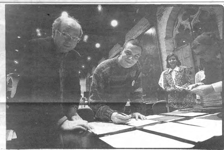
Het jongste gemeenteraadslid van Leuven glundert.