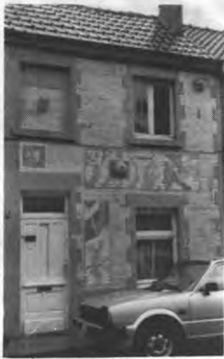
in Leuven immers vooral op een studentenpubliek gericht.

De gemiddelde huurprijzen voor huizen in Groot-Leuven stegen tijdens die zes maanden met 1.603 frank (per maand!). Een huis met twee slaapkamers, badkamer, keuken en centrale verwarming kon je huren voor 19.600 frank. Om over meer comfort te beschikken moest je toch al een bedrag van 25.000 frank per maand neertellen. Spit gaat ervan uit dat de huur slechts een derde van het maandinkomen mag bedragen om draaglijk te blijven. Heel wat kansarmen hebben grote problemen om nog menswaardig te kunnen leven. In toenemende mate moeten zij noodgedwongen hun toevlucht zoeken op één kamer. De concurrentie met de studenten verplicht hen dan echter tot het betalen van veel te hoge huurprijzen. In een studentenstad als Leuven slaan allerlei speculanten al gauw munt uit deze toestand. Het wonen op één kamer wordt door Spit verworpen, want kamers zijn te duur en ongeschikt voor alleenstaanden die er heel het jaar door moeten leven. De gemeubelde kamer is