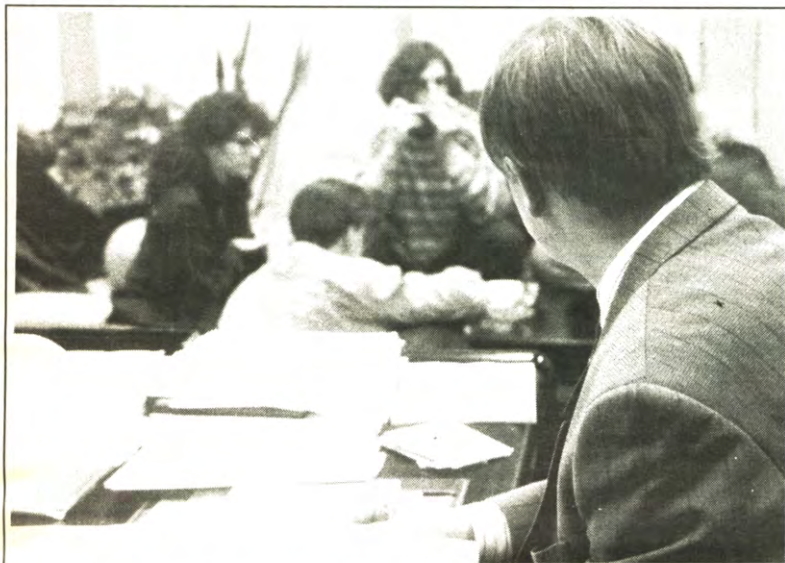
BEZETTING - Vorige week woensdag drongen studentenafgevaardigden van VUB, RUG en KU Leuven binnen in de partijgebouwen van de coalitiepartijen. Hun bedoeling was de partijvoorzitters van de CVP, de VU en de SP een tekst met hun gezamenlijk eisenplatform te laten ondertekenen. Daarmee wilden ze nogmaals uiten geven aan hun ongenoegen over het ontwerpdecreet Coens. De mogelijke invoering van een oriënteringsexamen, een studiepuntenstelsel en een vijfde jaar voor aggregatie, van de forfaitaire betoelaging van de universiteiten en de universitaire expansie, blijven immers in het decreet staan. Over de inhoud van en de achtergronden bij het decreet handelt ons extra nummer. In deze Veto meer over hoe de acties verlopen zijn. Op pag. 6.

STUDENTENWEEKBLAD VAN DE LEUVENSE OVERKOEPELENDE KRINGORGANISATIE - JAARGANG 17, 1990-1991, NUMMER 15, MAANDAG 14 JANUARI 1991