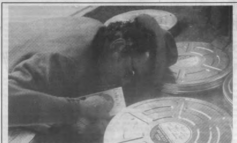
GODARD - "King Lear wordt gebruikt om de essentie, de verwondering om het beeld terug te vinden." Dit schreef Veto vorig jaar, toen het Stuc een retrospectieve opzette van de films van Jean-Luc Godard, de man op de foto. Dit jaar herneemt het Stuc 'King Lear', samen met een nog niet vertoonde film, 'Nouvelle Vague', op woensdag, donderdag en vrijdag (zie onze agenda).