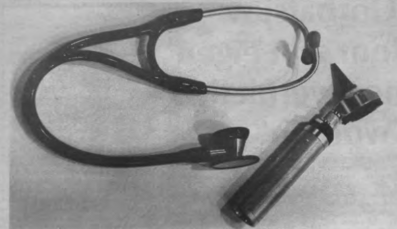
Deze nieuwste snuffes op medisch-technisch gebied geven wij hier toch een kans om meer bekendheid te verkrijgen dan het de Medikabeurs gelukt is.