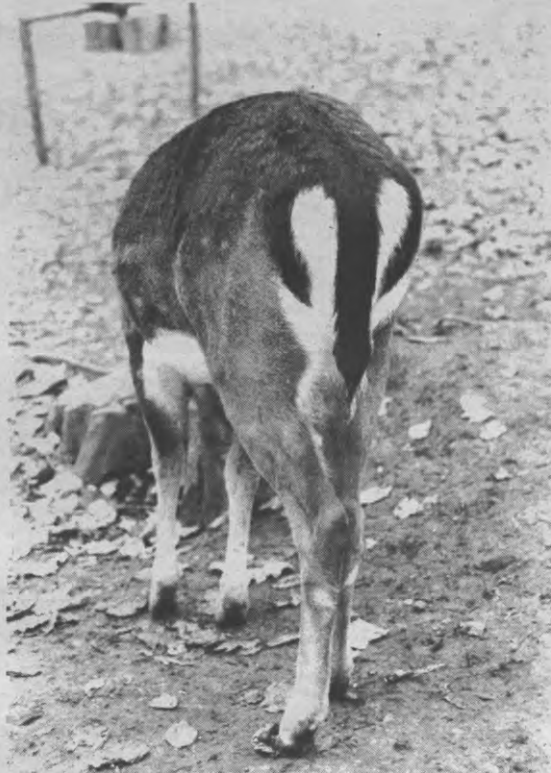
IN DE REEKS 'Beestigheden' laat Veto zich in de komende maanden van zijn mooiste kant zien. We beginnen alvast met moeders mooiste, elke dag te bezichtigen in het stadspark.