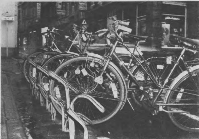
Lege fietsenrekken: zopas plichtsbewust agent voorbij gekomen?

D e zwarte vlaggen aan de panden der Leuvense middenstanders hangen daar niet als rouwbetuingen aan een onlangs overleden eminent politikus. De bedoeling van deze naargeestige doekjes is enkel het parkingprobleem van onze kleinhandelaars in de kijker te zetten. De gemiddelde Leuvenaar raakt zijn voiture blijkaar niet meer kwijt. Veto had het daar vorige week trouwens uitvoerig over en volgende week komen we hierop nog terug. In zekere zin kan je het fietsprobleem 'van hetzelfde laken een broek' noemen. Wij raken onze velo immers ook niet kwijt.