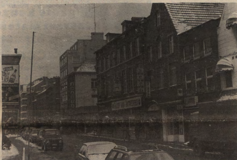
Zoals sommigen al weten is dit de Brusselstraat. Daarin ligt de drukkerij van Acco. Wie zoekt, die vindt op dit plaatje.

Donderdag 10 januari ging Sociale Raad eens binnen de muren van Acco een kijkje nemen. Zowel drukkerij, uitgeverij als verkoopcentrale werden onder de loep genomen. De respectieve directeurs van deze afdelingen zorgden telkens voor deskundige commentaar. Eigenlijk was dit bezoek een must voor al wie zich in zijn kring bezig houdt met zoiets als een kursusdienst of POC. Spijtig genoeg waren er niet meer dan een tiental gegadigden, waaronder dan nog de nieuw gekozen zaakvoerders van dit jaar die d'office aanwezig waren. De mensen van ACCO zelf anderzijds verheugden zich in wat zij een grotere belangstelling dan ooit vonden.