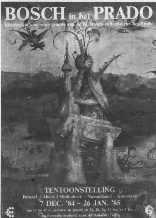
Fotografische reproducties van de beroemdste werken van Bosch van dichtbij te bewonderen in de Albert I bibliotheek te Brussel. Tot 26 januari.