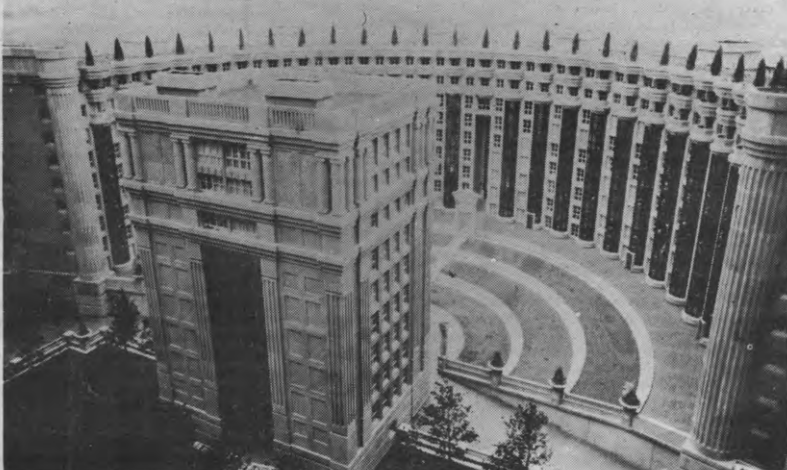
Palacio Abraxas in Parijs (1983); postmoderne architectuur van Ricardo Bofill, die de spot drijft met oude idealen: een triomfboog, een Grieks theater en een Engelse Crescent in een woonblok voor sociale huisvesting!

critici heel wat wrevel verwekt heeft. Een stuk inventiever is de Hongaar György Ligeti, die zich geprofileerd heeft in het spoor van een Bela Bartok. Ligeti's strijkwartetten zijn tegelijk experimenteel én toegankelijk. Ze sluiten kwa sferen en 'aura' aan bij de traditie, maar ze voegen daarbij de eigentijdse commentaar. Stanley Ku-