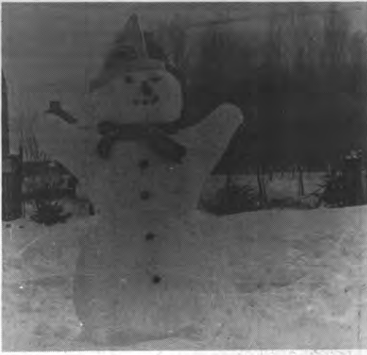
Veto verleent je warme oortjes en blozende kaakjes in deze Siberische tijden. Tenminste als je een wortelneus en je blik op de horizon gericht houdt.